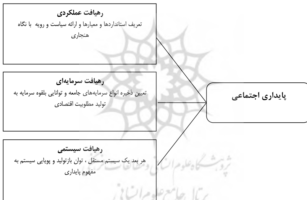
شکل ۲. ره‌یافت‌های غالب در پایداری اجتماعی

مطالعه ۱ ، چارچوب اولیه‌ای تنظیم شد که با مراجعه به خبرگان، تعیین اعتبار و منطبق بر شرایط کشور شد. تعریف پایداری اجتماعی در این مطالعه به حفظ و ارتقا موزون جامعه محلی با