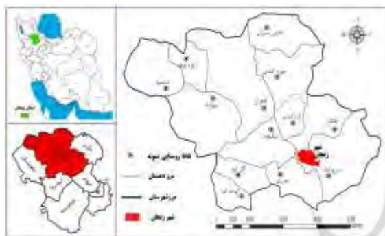
شکل ۲. موقعیت شهرستان زنجان در تقسیمات سیاسی کشور (ترسیم: نگارنده، ۱۴۰۰)

منبع: حیدری و حضرتی، ۱۳۹۹؛ بذرافشان و همکاران، ۱۳۹۶؛ رضوانی و همکاران، ۱۳۹۶