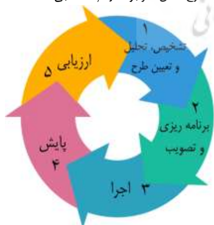
شکل ۱. چرخه مشارکتی پروژه با مشارکت کنشگران توسعه روستایی

مفهوم کنشگر از دیدگاه کاستلز به «گستره‌ای از موضوعات مرتبط با کنش هم‌چون کنشگران فردی، کنشگران گروهی، سازمان‌ها، نهادها و شبکه‌ها اشاره دارد (توسلیان و حضرتی، ۱۳۹۸: ۳). طبق این مفهوم، تمام سازمان‌ها، نهادها، و شبکه‌ها به گونه‌ای بر عملکرد کنشگران انسانی دلالت می‌کنند (Castells, 2009: 11). بر اساس رویکرد کنش‌گر، شبکه دریافتی از قدرت و بازی، قدرت را فراهم می‌سازد که امکان می‌دهد هم‌زمان، هم تأثیر کنشگران بر پیدایش سیاست‌ها و تصمیم‌سازی‌های برنامه‌ریزی شناخته شود و هم تأثیر زمینه‌های ساختاری که زمینه عمل کنشگران را تشکیل می‌دهد (سعیدی و طالشی، ۱۳۹۶: ۴۵۹). لذا، فعالیت‌های مرتبط با کنشگری، گستره وسیعی دارند و از نوشتن نامه‌های سرگشاده به روزنامه‌ها و سیاست‌مداران تا برگزاری کارزارهای سیاسی، بایکوت اقتصادی، راهپیمایی خیابانی، اعتصاب، تحصن و اعتصاب غذا را شامل می‌شود (توسلیان و حضرتی، ۱۳۹۸: ۳). این در حالی است که برخی از کنشگران تلاش می‌کنند تا به جای اعمال فشار بر دولت‌ها برای تغییر و بازنگری در قوانین، مردم را به تغییر رفتار و سبک زندگی‌شان ترغیب کنند (Obar, 2012: 7). در رابطه با نحوه مشارکت کنشگران توسعه روستایی در پروژه‌ها و برنامه‌های مشارکتی روستا، ۵ مرحله یا چرخه به شرح شکل ۱ وجود دارد (استلاجی، ۱۳۹۱: ۲۴۶).