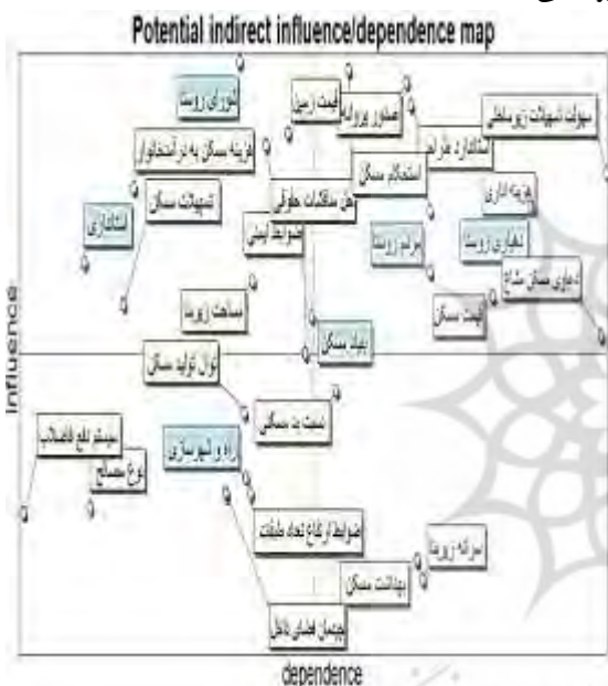
شکل ۴. روابط بین بازیگران و اهداف

است. در بخش چهارم، بازیگران مغلوب قرار دارند که در این تحقیق هیچ بازیگری در این قسمت قرار نگرفته است. این عامل نشان می‌دهد که در امر برنامه‌ریزی مسکن روستایی و مدیریت توسعه روستا، تمامی بازیگران و کنشگران، نقش فعالی دارند و به نوعی در فرایند توسعه روستایی تأثیرگذار هستند. در این رابطه شاخص‌های «نسبت بد مسکنی، بهداشت مسکن و سرانه زیربنا» در بخش مغلوب قرار دارند. پیشران‌های این بخش تحت تأثیر مؤلفه‌ها و بازیگران دیگر به‌ویژه بنیاد مسکن انقلاب اسلامی، دهیاری روستا و ساکنین روستا نتوانسته‌اند، تأثیر قابل توجهی در ساماندهی و توسعه مسکن مطلوب روستایی داشته باشند.