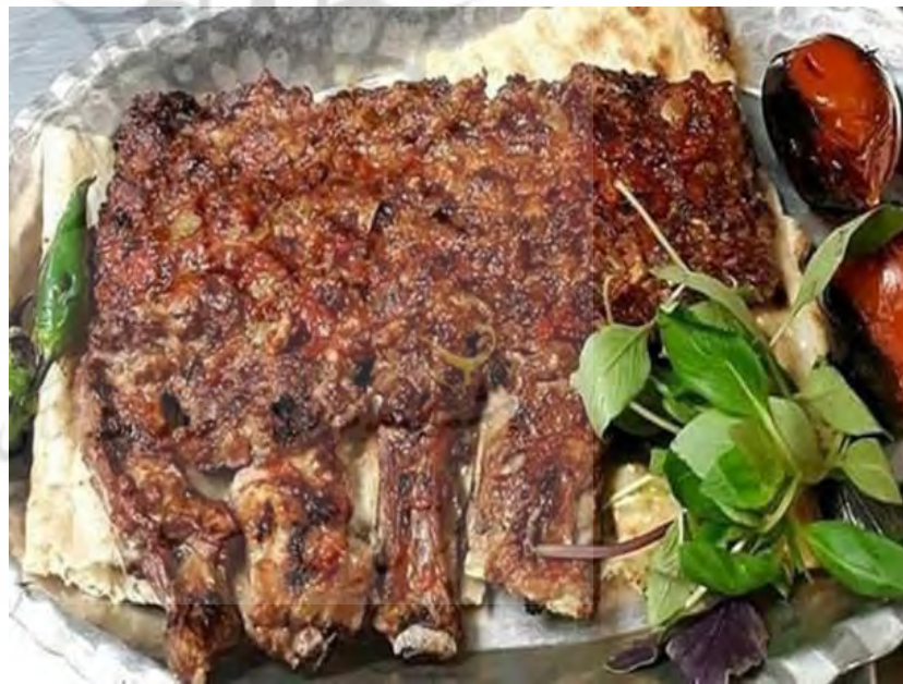
کرمانشاه شهر خلاق خوراک