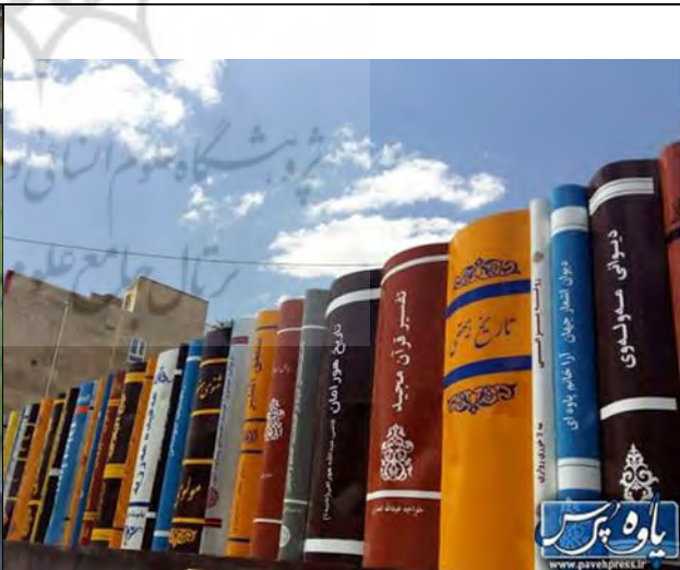
خلاقیت شهرداری پاوه کنار مسجد جامع