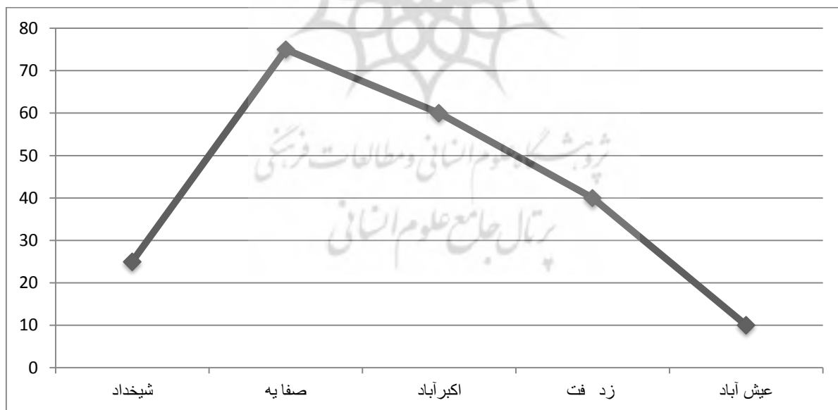
شکل ۳. میانگین کیفیت محیط شهری در محلات

همان‌طور که مشاهده می‌شود مقدار p -value از ۰/۰۵ کمتر است. لذا نتیجه گرفته می‌شود که تفاوت در میانگین کیفیت محیط شهری در محلات مختلف معنادار است. محله صفائیه، بالاترین میانگین کیفیت محیط شهری و محله عیش‌آباد، پایین‌ترین میانگین را به خود اختصاص داده است. همچنین با توجه به شکل شماره ۳ مشخص شد که نمودار میانگین‌ها تفاوت‌های زیادی را در بین محلات مختلف نشان می‌دهد که نشان‌دهنده این است که کیفیت محیط شهری در شهر یزد فرازوفرودهای زیادی دارد که باعث فاصله طبقاتی در سطح محلات شده است.