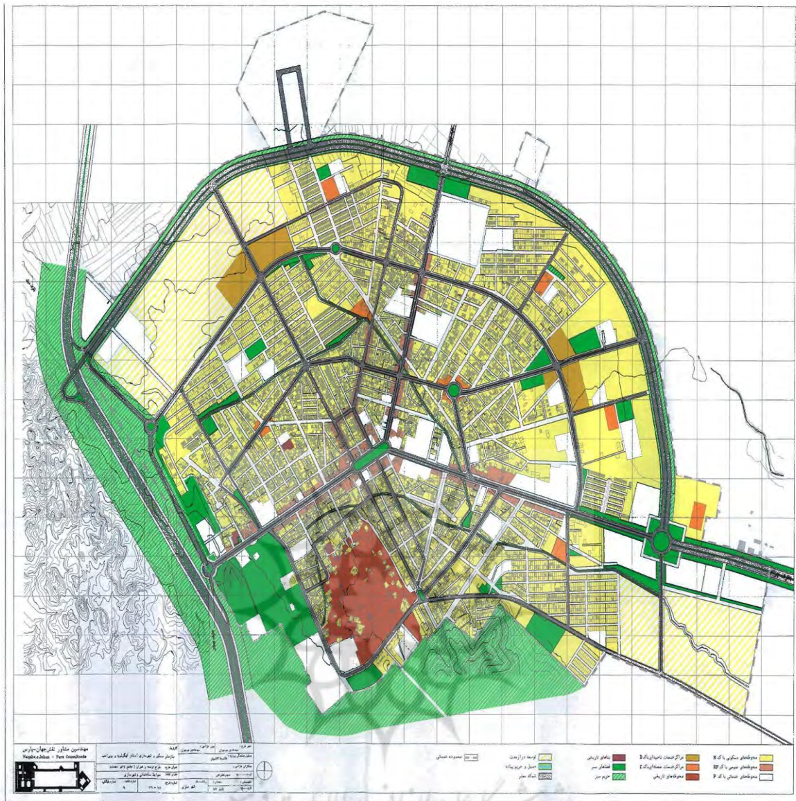
نقشه ۳: نقشه طرح توسعه شهردهدشت (طرح جامع دهمدشت ۱۳۸۲)