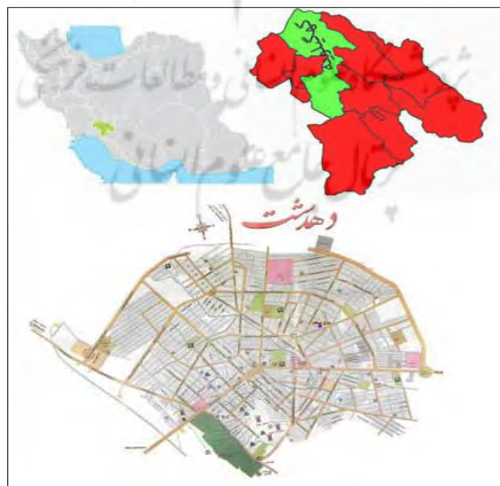
شکل ۱: نقشه موقعیت جغرافیایی شهر دهدشت در شهرستان، استان و کشور (وب سایت شهرداری

موقعیت جغرافیایی شهر و اطراف آن شهر دهدشت در میان دشتی به همین نام و در فاصله تقریبی ۶۰ کیلومتری شرق بهبهان قرار دارد. این دشت در حوضه آبریز رودخانه خیرآباد قرار دارد. فاصله تقریبی این دشت از رودخانه مارون در شمال آن حدود ۲۰ کیلومتر است. رودخانه فصلی دهدشت از میان این دشت و از نزدیکی شهر دهدشت گذشته و کلیه سیلاب ها و زهاب های منطقه را وارد رودخانه خیرآباد می کند. شهر دهدشت در میان دشت مذکور با طول جغرافیایی ۳۴-۵۰ و عرض جغرافیایی "۴۸"-۳۰ و با ارتفاع ۸۱۰ متر از سطح دریا قرار گرفته است. آنها در قله کوه سیاه به ۲۳۳۰ متر می رسد به سمت غرب، به خاطر گسترش رسوبات گچی و ماسه سنگی از ارتفاعات کاسته شده، به طوری که در اطراف دهدشت به صورت تپه ماهورهایی ظاهر شده اند، این دشت باروندی شمال غربی - جنوب شرقی به طول حدود ۱۱ کیلومتر و عرض حدود ۳ کیلومتر در منطقه گسترش دارد.