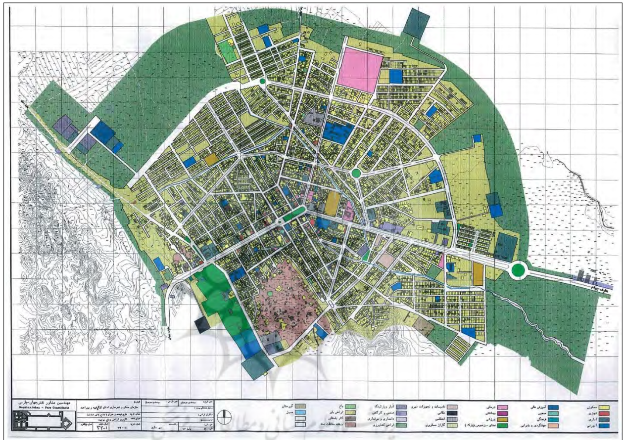
نقشه ۲: نقشه کاربری اراضی وضع موجود شهردهدشت (طرح جامع دهدهشت ۱۳۸۲)