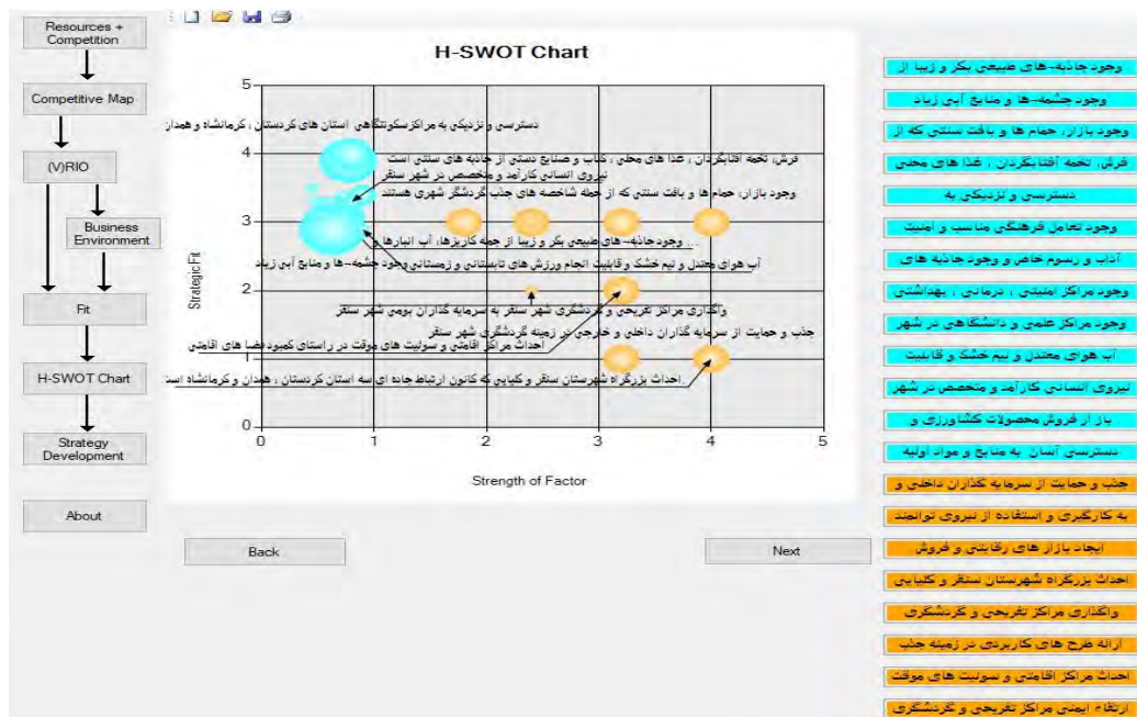
شکل شماره ۶. نقشه راهبردی توسعه گردشگری شهر سنقر

نتایج نشان می‌دهد منابع و قابلیت‌های شهر سنقر از اوزان متفاوتی برخوردار است. به گونه‌ای که وجود جاذبه‌های طبیعی بکر و زیبا، وجود بازار، حمام‌ها و بافت‌های سنتی، آب‌وهوای معتدل و نیم خشک به ترتیب مهم‌ترین منابع و قابلیت شهر سنقر در جهت توسعه گردشگری می‌باشند. همچنین اندازه حباب‌های نارنجی که نشان‌دهنده درجه ضرورت عوامل و راهبردهای پیشنهادی هستند نشان می‌دهد که جذب و حمایت از سرمایه‌گذاران داخلی، به کارگیری و استفاده از نیروی توانمند، ایجاد بازارهای رقابتی و فروش، احداث بزرگراه شهرستان سنقر و کنایه، واگذاری مراکز تفریحی و گردشگری، ارائه طرح‌های کاربردی بر زمینه جذب، احداث مراکز اقامتی و سونیت‌های موقت، ارتقاء ایمنی مراکز تفریحی و گردشگری، جذب و حمایت از سرمایه‌گذاران داخلی و به کارگیری و استفاده از نیروی توانمند، بازارهای رقابتی و فروش، احداث بزرگراه شهرستان سنقر و کنایه، واگذاری مراکز تفریحی و گردشگری، ارائه طرح‌های کاربردی بر زمینه جذب، احداث مراکز اقامتی و سونیت‌های موقت، ارتقاء ایمنی مراکز تفریحی و گردشگری.