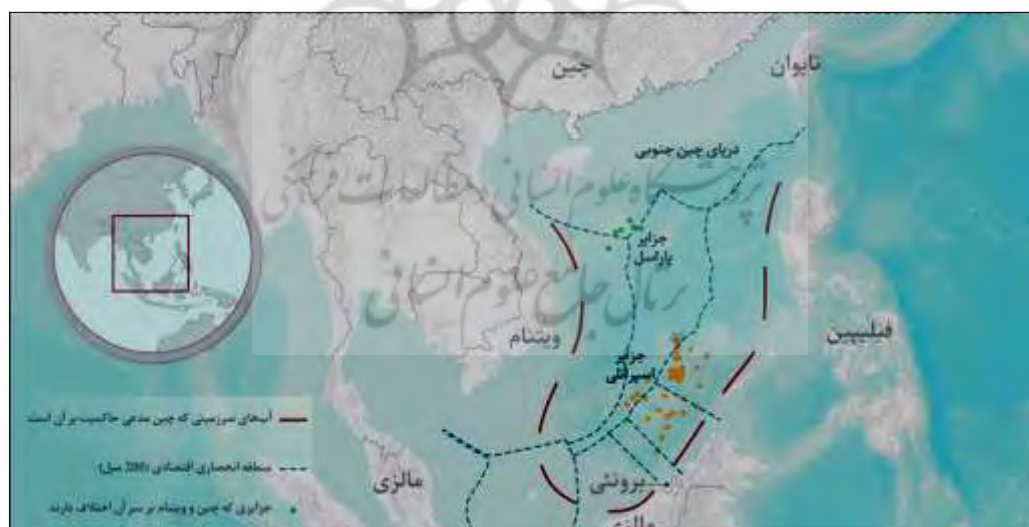
نقشه ۲. دریای چین جنوبی

به نظر کنت والتس افزایش قدرت اقتصاد چین تمایل برای رشد نفوذ منطقه‌ای را برای این کشور به همراه داشته و این امر باعث شده است که امریکا خیزش چین را تهدیدی برای منافع، هژمونی، و متحدان منطقه‌ای خود قلمداد کند. تلاش چین برای سلطه بر دریای چین جنوبی یکی از بزرگ‌ترین تهدیداتی است که پیش روی منافع امریکا در جنوب آسیا قرار گرفته است (دهشیار و همکاران، ۱۳۹۱: ۶). به‌طوری‌که بخشی از راهبرد چین برای گسترش نفوذ به سمت اقیانوس هند است که از نظر راهبردی می‌تواند منافع امریکا در مناطق دریایی این منطقه و همچنین در کشورهایی نظیر فیلیپین، مالزی، و اندونزی را در معرض خطر قرار دهد (نقشه ۲).