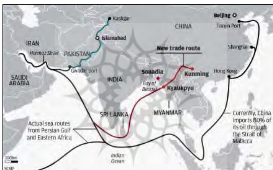
نقشه ۱. مسیرهای عمده ارتباطی چین در شمال اقیانوس هند و مسیر ارتباطی دریایی - زمینی گوادر - کاشغر

نظر تلاش برای مهار نفوذ چین با هند هم‌نظر است، به ایجاد تعادل با قدرت دریایی در حال گسترش چین و نفوذ اقتصادی این کشور در منطقه اقیانوس هند و مناطق پیرامونی پردازد (برزگر و رضائی، ۱۳۹۶: ۶). یکی دیگر از اولویت‌های ژئوپلیتیک هند گسترش همکاری با کشورهای عضو آسه‌آن است. گسترش همکاری با این کشورها به هند اجازه می‌دهد به صورت مؤثری بر خطوط مواصلاتی واقع در اقیانوس هند نظارت داشته باشد و به این ترتیب در مقابل چین به برتری دست یابد و از مزیت موقعیت جغرافیایی خود به نحو مناسبی بهره‌برداری کند (نقشه ۱). از طرف دیگر، کشورهای عضو آسه‌آن، در قالب راهبرد گسترش تعامل شبکه‌ای در اقتصاد و سیاست جهانی، افزایش حضور هند در جنوب شرق آسیا را امری مثبت قلمداد می‌کنند که باعث گسترش موازنه قدرت در این منطقه از جهان می‌شود و از برتری مطلق چین در شرق آسیا جلوگیری می‌کند. علاوه بر این، نباید از یاد برد که هند به دنبال آن است تا با گسترش نفوذ خود از فلات ایران تا منطقه خلیج تایلند به قدرت برتر ژئوپلیتیک در شمال اقیانوس هند مبدل شود (همان: ۷). مسئله سرمایه‌گذاری هند در بندر چابهار در این چارچوب قابل تحلیل است (همان).