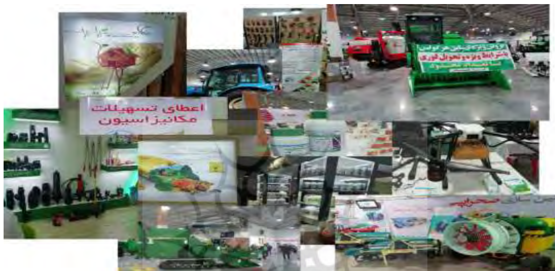
تصویر ۱. تبلیغات و مشوق‌های خرید

نظریهٔ چرخهٔ تولید به جامعهٔ مدرن و صنعتی می‌پردازد و دربارهٔ سودجویی شرکت‌ها، نقش و تأثیر دولت و نهادهای دولتی در حفظ یا تخریب محیط زیست، نابرابری‌ها در قدرت تصمیم‌گیری دربارهٔ محیط زیست و نیز نابرابری در درگیری با پیامدهای این تصمیم‌ها و شرایط بد محیط زیستی نیز توضیح می‌دهد. اشنایبرگ مطرح می‌کند که رقابت در اینجا بر سر دستیابی به منابع بیشتر برای تولید بیشتر و سود بیشتر است. امروزه، در کنار روش سنتی کشت توسط کشاورزان مازندرانی، شرکت‌های تولیدی، کشت و صنعت‌ها، کارخانجات تولید و فروش خوراک دام و طیور و غیره نیز قرار گرفته‌اند که مبتنی بر کسب سود هستند و صنعت‌گرایی (عنبری، ۱۳۹۵: ۳۵) مشخصهٔ بارز آن‌هاست.