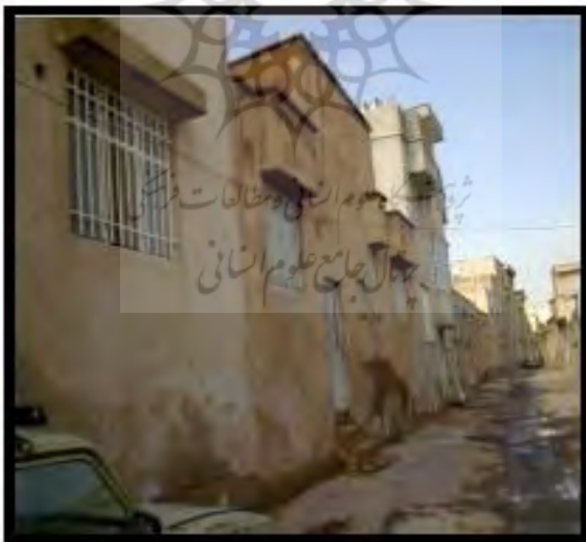
شکل ۱- بافت فرسوده شیراز (نادر کاظمی)

این ناحیه که در شکل (۱) و (۲) دیده میشود در تقسیمات طرح تفصیلی از ۲ محله تشکیل شده و دارای شکل خطی است. از نظر استقرار، مجاور بلوار مدرس تا میدان ولیعصر و خیابان تختی تا میدان دروازه اصفهان در غرب است. محدوده مورد نظر