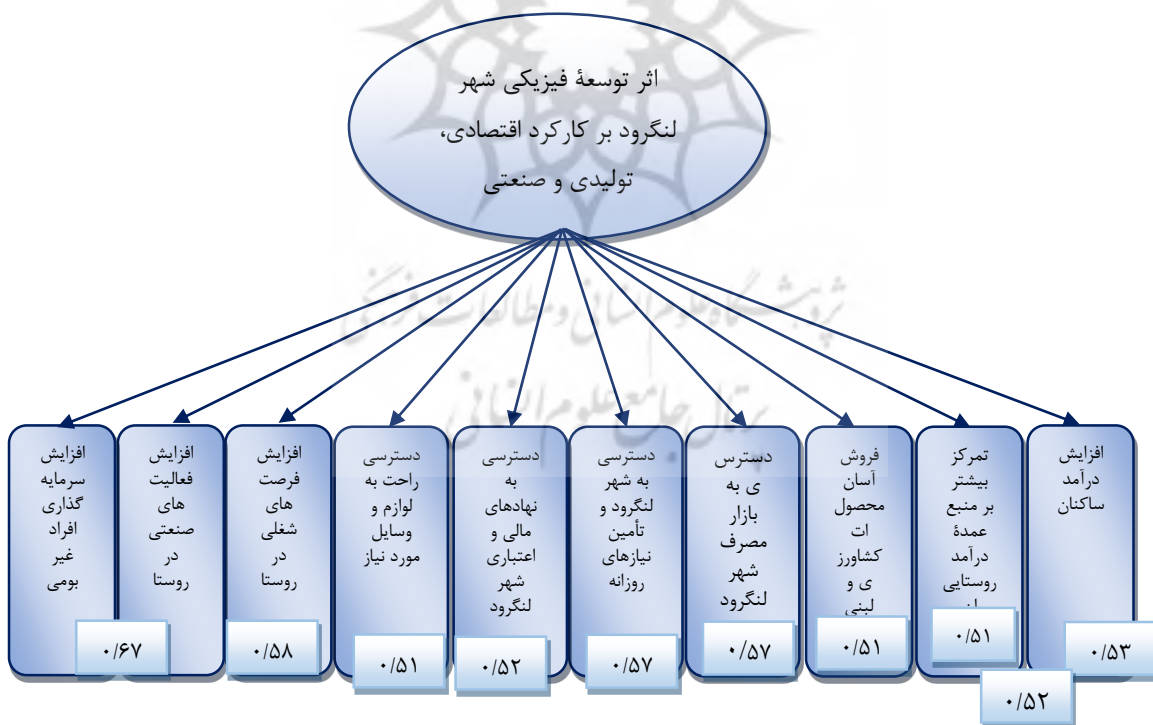
شکل ۳- مدل تحلیل مسیر اثر توسعه فیزیکی شهر لنگرود بر تغییرات کارکرد اقتصادی، تولیدی و صنعتی روستاهای پیراشهری