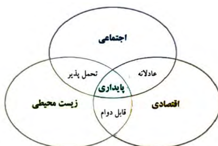
شکل (۲): طرح پایداری در محل تلاقی ابعاد پایداری