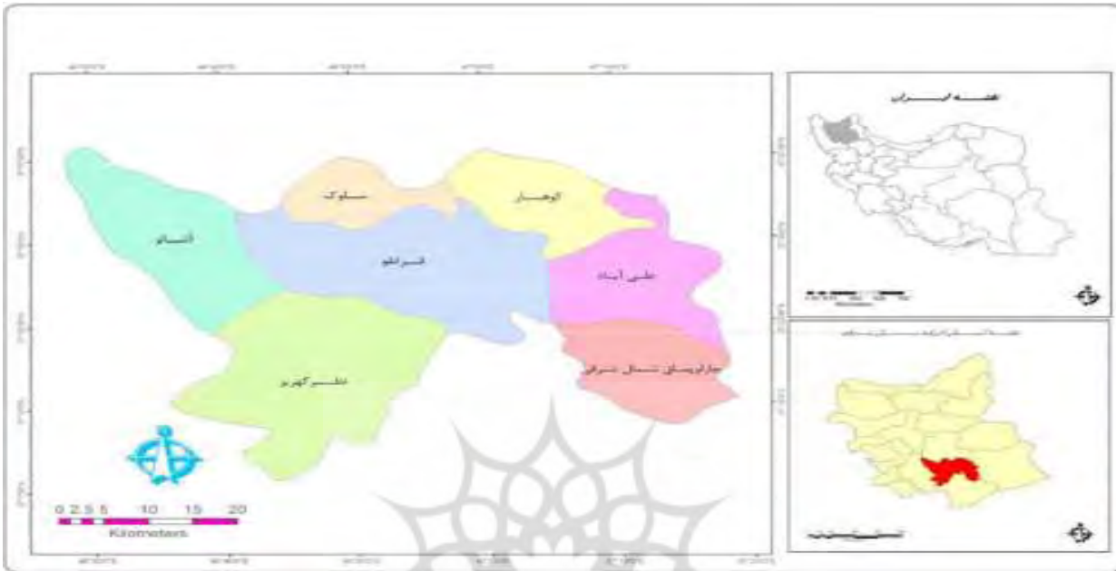
شکل - ۱: نقشه منطقه مورد مطالعه

۸۵ حدود ۱۰هزار نفر و از سال ۸۵ تا سال ۹۵ حدود ۹ هزار نفر جمعیت این شهرستان کاسته شده است. برخلاف کاهش جمعیت شهرستان، جمعیت شهری آن طی ۱۵ اخیر افزایش قابل توجهی سال داشته که علت آن مهاجرت‌های روستا-شهری است (مرکز آمار ایران، ۱۳۹۵).