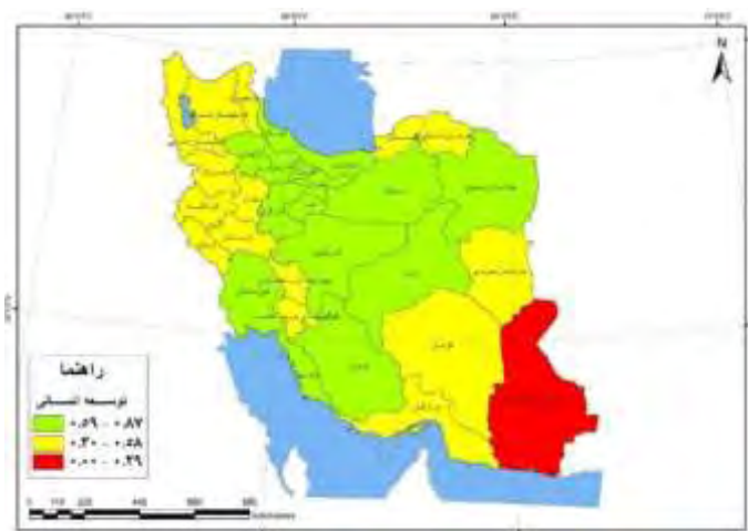
شکل - ۴: شاخص توسعه انسانی استان‌های ایران