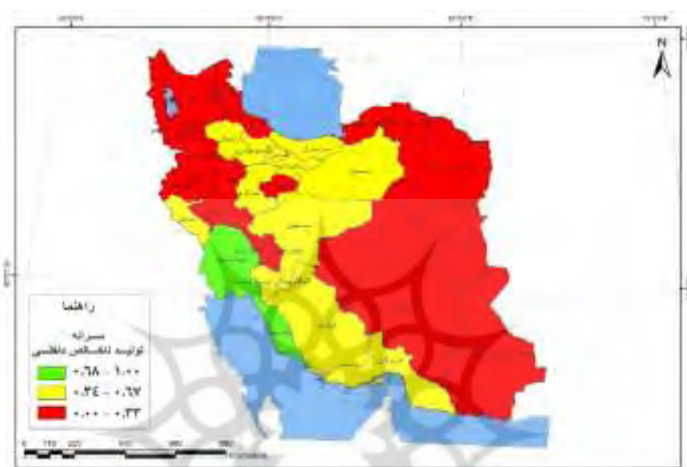
شکل - ۱: شاخص تولید ناخالص داخلی استان‌های ایران

رابطه بین میزان زوداشتغالی و سطح توسعه انسانی استان‌ها براساس ضریب همبستگی منفی (۰/۴۰۲) نشان از رابطه معکوس با سطح معناداری کمتر از ۰/۰۵ دارد. در سطح شاخص‌های سه‌گانه، بین اشتغال زودرس با سرانه تولید ناخالص داخلی با ضریب (۰/۳۴۹-) و سواد (۰/۳۴۵-) رابطه مشابهی وجود دارد، ولی بین زوداشتغالی با امید به زندگی (۰/۳۱-) در سطح معناداری ۰/۰۸ با اطمینان ۹۲ درصد رابطه نسبتاً ضعیفی برقرار شده است؛ بنابراین عوامل دیگری بر شاخص امید به زندگی مؤثر است که منطبق بر اشتغال زودرس نیست؛ بر این مبنای اشتغال زودرس تا حدی بر امید به زندگی تأثیر داشته است.