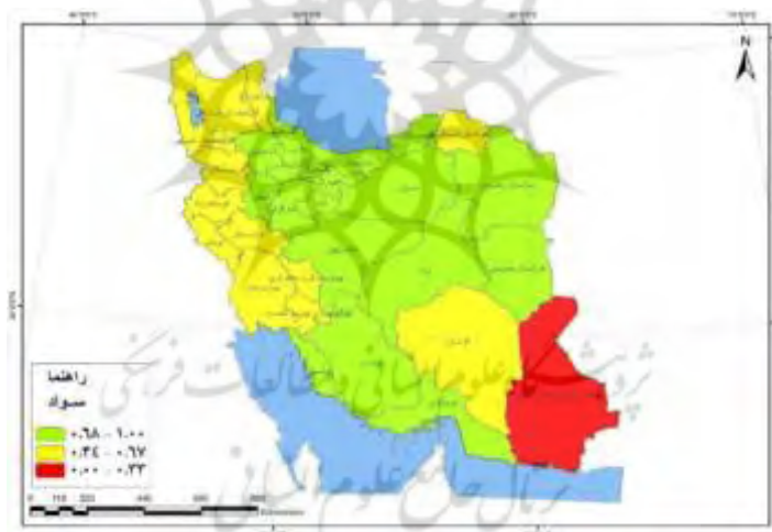
شکل - ۳: شاخص سواد استان‌های ایران

براساس شکل ۲ شاخص امید به زندگی در استان‌های البرز و تهران و بخش عمده‌ای از مناطق مرکزی، شمال و شمال غربی در سطح بالا و فقط استان سیستان و بلوچستان در پایین‌ترین سطح قرار دارد. سایر استان‌ها، بیشتر در مناطق مرزی شمال شرق، جنوب و غرب کشور در گروه متوسط هستند.