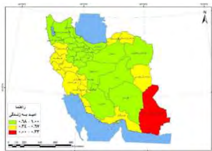
شکل - ۲: شاخص امید به زندگی استان‌های ایران