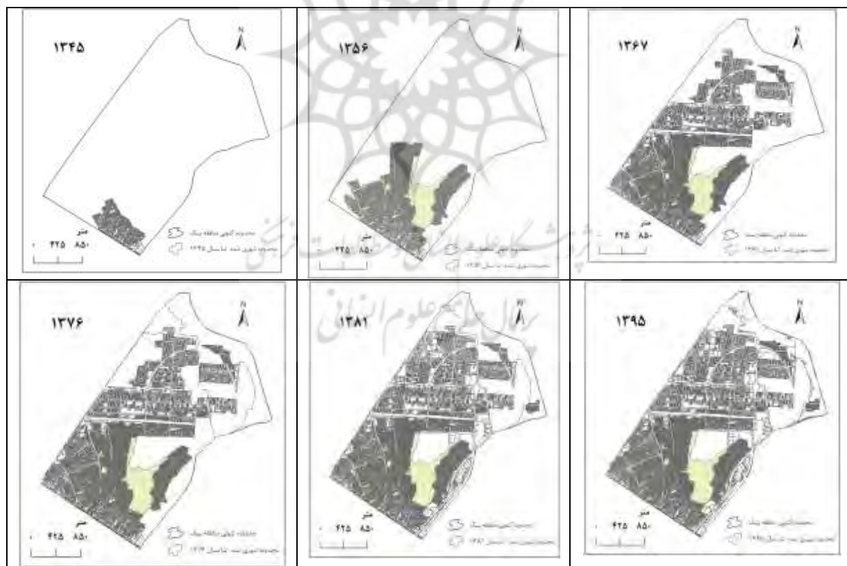
شکل - ۲: تکوین و رشد فیزیکی منطقه یک شهرداری کرج

بنیان اولیه سکونت و شهری کردن اراضی کشاورزی و مرتعی در محدوده‌ای که اکنون شهرداری منطقه یک کرج را تشکیل داده، در دهه ۱۳۴۰ پی‌ریزی شده است. تا سال ۱۳۴۵ وسعت اراضی ساخته‌شده و شهری‌شده در این محدوده فقط ۴۱/۴ هکتار بود. با افزوده‌شدن ۱۷ هکتار، وسعت این زمین‌ها در سال ۱۳۵۶ به ۵۸/۴ هکتار رسید. طی دوره زمانی ۱۳۵۶ تا ۱۳۶۷، هر سال ۲۶/۴ هکتار بر وسعت محدوده شهری اضافه شد تا اینکه در پایان سال ۱۳۶۷ وسعت این زمین‌ها به حدود ۳۵ هکتار رسید. از آن پس رشد فیزیکی شهر فروکش کرد؛ با این حال در دوره ۹ ساله ۱۳۶۷ تا ۱۳۷۶ باز هم هر سال ۸/۴ هکتار بر وسعت زمین‌های شهری‌شده منطقه یک افزوده شده و مساحت این زمین‌ها به رقم ۴۲۴ هکتار رسیده است. با شتاب‌گیری دوباره رشد فیزیکی شهر در دوره ۵ ساله پس از ۱۳۷۶، هر سال ۳۰ هکتار بر مساحت زمین‌های شهری‌شده اضافه شد و وسعت این زمین‌ها رقم ۵۷۴ هکتار را در سال ۱۳۸۱ پشت سر گذاشت. در دوره زمانی ۱۳۸۱ تا ۱۳۹۵، با اشباع‌شدن اراضی، کمترین میزان رشد از زمان پیدایش این منطقه شهری رقم خورده است. در این دوره ۱۴ ساله هر سال حدود یک هکتار بر وسعت زمین‌های شهری‌شده افزوده شده و اکنون مساحت این زمین‌ها بیش از ۷۱۷ هکتار است. این رشد فیزیکی، نمونه‌ای تقریباً منحصربه‌فرد در مناطق شهری ایران است.