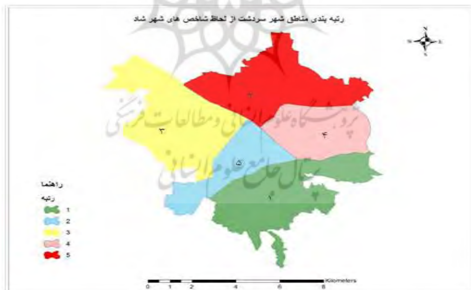
شکل ۳- رتبه‌بندی مناطق ارومیه از لحاظ شاخص‌های شهر شاد