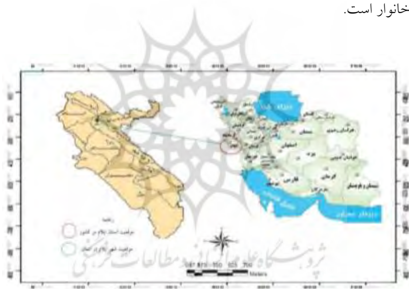
شکل ۱- موقعیت جغرافیایی محدوده مورد مطالعه

شهر ایلام، مرکز استان ایلام از نظر موقع جغرافیایی در ۴۶ درجه و ۲۶ دقیقه طول شرقی و ۳۳ درجه و ۳۸ دقیقه عرض شمالی واقع شده است و از نظر موقعیت در غرب و جنوب غربی کشور قرار دارد. این شهر در دامنه جنوبی کبیرکوه از سلسله جبال زاگرس واقع شده است. شهر ایلام از شمال، شرق و جنوب شرقی به شهرستان‌های ایوان و شیروان چرداول و دره شهر، از جنوب و جنوب غربی به شهرستان مهران و از غرب به استان دیاله عراق محدود است. در سال ۱۳۹۰، مساحت شهر ایلام برابر ۱۷۰۱/۴۲ هکتار بوده که به ۴ منطقه، ۱۴ ناحیه و ۳۸ محله شهری تقسیم شده است. همچنین، دارای جمعیتی برابر با ۱۷۲۲۱۳ نفر در قالب ۴۲۶۱۶ خانوار است.