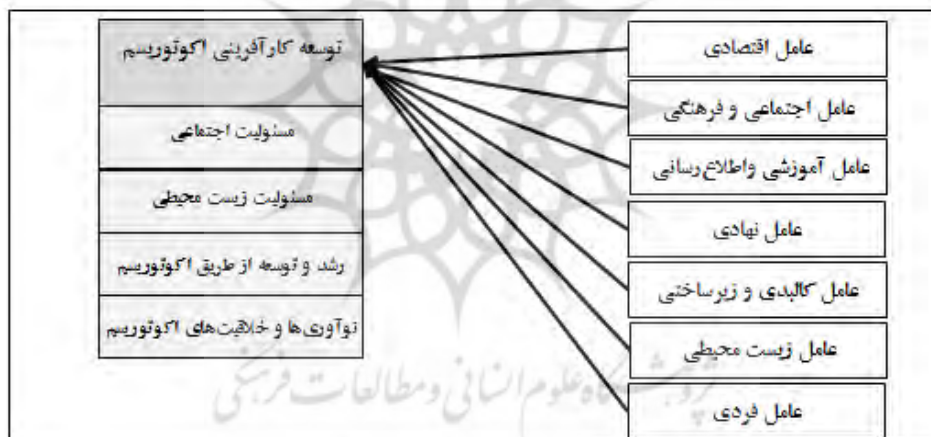
تصویر ۲: مدل توسعه کارآفرینی اکوتوریسم روستایی

همچنین براساس نتایج سه دور دلفی، مدل توسعه کارآفرینی اکوتوریسم روستایی تدوین شد که در تصویر (۲) آورده شده است. مدل ارائه شده در این پژوهش