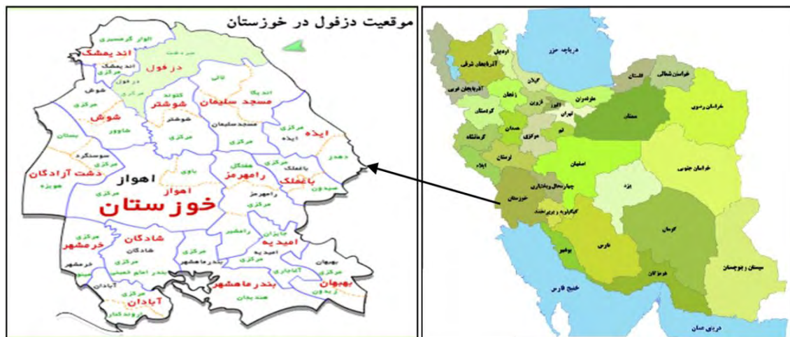
تصویر ۱: موقعیت شهرستان دزفول در استان خوزستان ( https://fa.wikipedia.org )