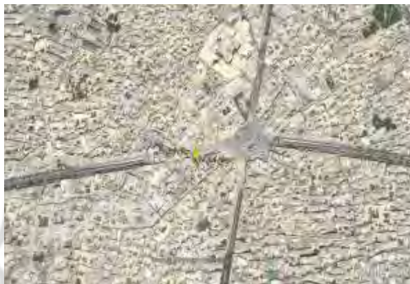
شکل ۱. محدوده میدان در سال ۱۳۸۹ Fig. 1. Area of Square in 2010