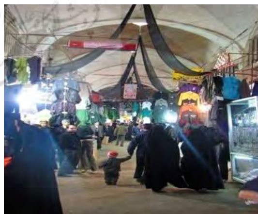
شکل ۳. بخشی از میدان امام علی (ع) پیش از احیا

Fig. 4. Part of Imam Ali (AS) Square after revival