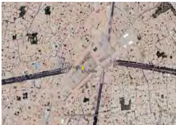
شکل ۲. محدوده میدان در سال ۱۴۰۰ Fig. 2. Area of Square in 2021

در جریان تهیه طرح جامع شهر اصفهان توسط مهندسين مشاور نقش جهان پارس به‌طور جدی مطرح شد (مهندسين مشاور نقش جهان پارس، ۱۳۸۸). طرح احیای میدان عتیق که بعداً در سال ۱۳۸۷ سازمان نوسازی و بهسازی شهرداری اصفهان آن را کلید زد، نمونه‌ای بارز از اقدامات بازآفرینی در شهر اصفهان به شمار می‌رود. این طرح اهداف متعددی دارد؛ اهداف کلان آن تقویت نقش تاریخی، فرهنگی و گردشگری این محدوده در شهر اصفهان، اعتلای کیفیت زندگی اجتماعی و افزایش کارایی و بهره‌وری زمین در محدوده طرح است. شکل ۱ و ۲ محدوده میدان عتیق را پیش و پس از بازآفرینی نشان می‌دهد.