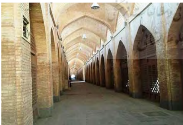
شکل ۴. بخشی از میدان امام علی (ع) پس از احیا