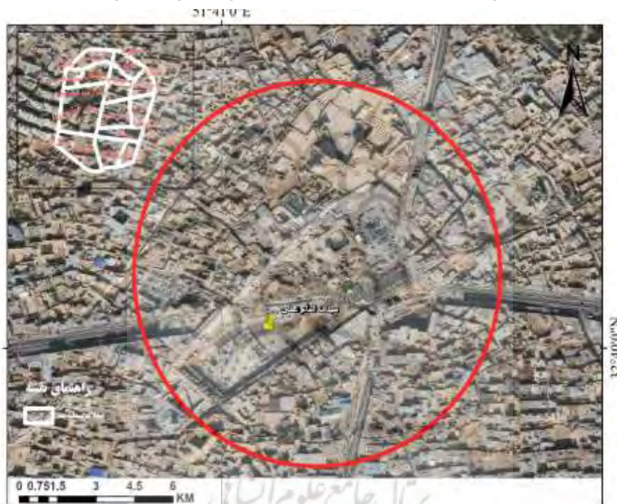
شکل ۵. موقعیت مجموعه میدان امام علی (ع) در منطقه سه شهر اصفهان

میدان امام علی (ع) و مجموعه احداث‌های اطراف آن وسعتی برابر با ۳۲,۵ هکتار دارد. این مجموعه در منطقه سه شهرداری اصفهان قرار گرفته است. منطقه ۳ شهرداری اصفهان وسعتی برابر با ۱۱۰۰ هکتار و جمعیتی برابر با ۱۱۱۸۱۶ نفر دارد. این منطقه از شرق به خیابان بزرگمهر، از شمال به خیابان‌های سروش و مدرس، از غرب به خیابان چهارباغ عباسی و میدان انقلاب و از جنوب به زاینده‌رود منتهی می‌شود. محدوده طرح خیابان‌های هاتف در جنوب، علامه مجلسی در شمال، ولی عصر در شرق و عبدالرزاق در غرب را قطع می‌کند. در شکل‌گیری و تعریف محدوده طرح میدان امام علی (ع) عناصر شاخصی چون محور بازار، مسجد جامع عتیق، مسجد و مدرسه علمیه کاسه‌گران، مجموعه هارون ولایت، محور هارونیه و مسجد علی مؤثر بوده است. در سال‌های اخیر این پروژه، مهم‌ترین پرهزینه‌ترین پروژه مرمت و طراحی شهری اصفهان بوده است (ابراهیمی بوزانی و فدایی جزی، ۱۳۹۹: ۳۵).