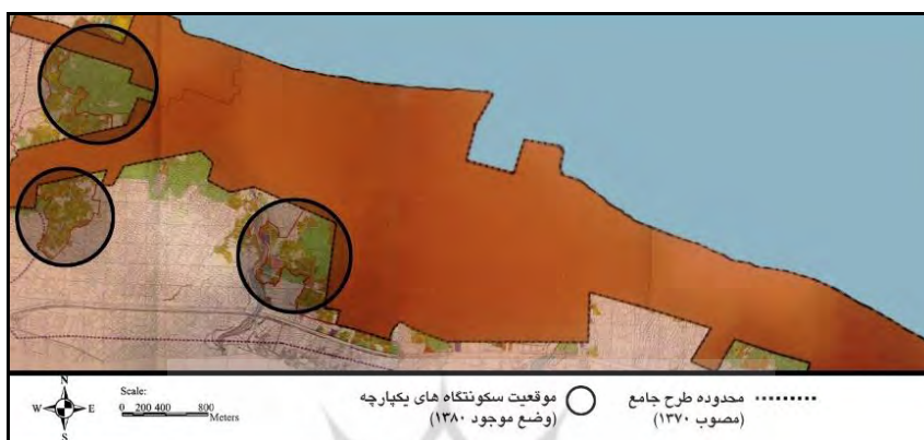
شکل ۳. محدوده نوشهر در طرح جامع و موقعیت سکونتگاه‌های دارای پیوستگی کالبدی- فضایی

جداناپذیر شهر رقم خورده است. متعاقباً این چالش، با توجه به ابعاد اجتماعی- کالبدی وابسته، تأثیر ویژه و قابل توجهی بر تحقق‌پذیری و کارآمدی طرح جامع نوشهر داشته است.