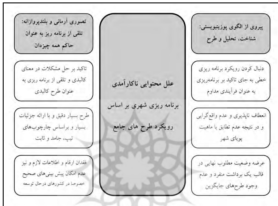
شکل ۱. علل محتوایی ناکارآمدی برنامه ریزی شهری بر اساس رویکرد طرح های جامع (مأخذ: یافته های سطح نظری پژوهش)

برآوردهایی هستند که با واقعیات فاصله دارند و در عمل محقق نمی‌شوند، از موارد دیگر قابل توجه در این زمینه است.