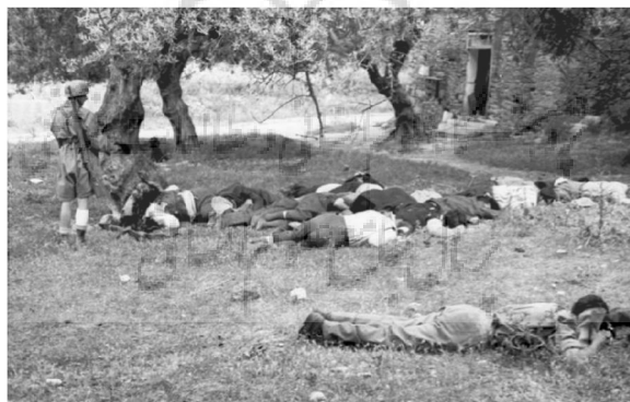
تصویر شماره ۱: قتل غیرنظامیان یونانی در کوندماری، کرت توسط چتربازان آلمانی ۱۹۴۱م

ب. همچنین جنایات هولناک آلمان نازی در جریان جنگ جهانی دوم امری هویدا بوده و هنوز برخی اثرات آن گریبانگیر جامعه بین‌المللی است. ۴ اردوگاه‌های کار اجباری، کشتار اسرای روسی و لهستانی و... تنها گوشه‌ای از جنایاتی است که آلمان در فاصله‌ای نه‌چندان دور در کارنامه دارد. ۵