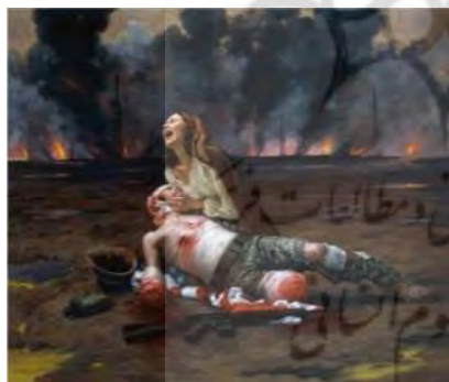
تصویر شماره ۸- مکس گینزبرگ، جنگ پیتا، ۲۰۰۷، رنگ روغن روی بوم، ۱۵۲.۴ × ۱۰۱.۶