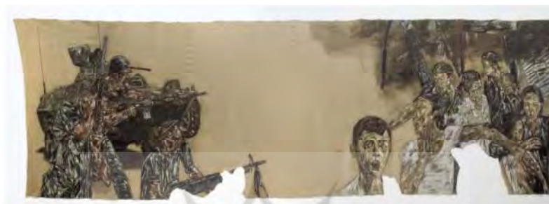
تصویر شماره ۴- لئون گالوب، ویتنام II، ۱۹۷۳، Smithsonian American Art Museum