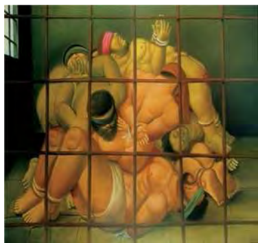
تصویر شماره ۶- فرناندو بوترو، زندان ابوغریب، ۲۰۰۵، رنگ روغن روی بوم