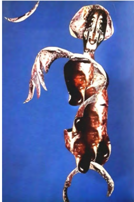
تصویر ۲: کلاژ شماره ۵، پروانه اعتمادی، ۱۳۸۲ (اعتمادی، ۱۳۸۳)