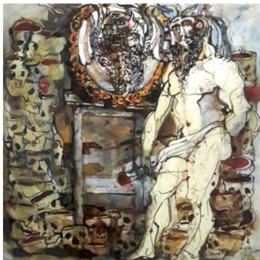
تصویر ۳: بدون عنوان، احمد امین نظر، ۱۳۷۵ (امین نظر، ۱۳۸۹)

مؤلفه‌های گروتسک در نقاشی احمد امین نظر تلفیق عناصر ناجور و ناهمگون، که باعث به وجود آمدن اثر هنری نامتعارف و عجیب و غریب می‌شود و در نهایت به ناهماهنگی در کل اثر می‌انجامد، از شاخصه‌های اصلی گروتسک است. در نمونه تصویری فوق (تصویر ۳)، امین نظر با ترسیم موجودی تلفیقی و هیولوار این ناهماهنگی گروتسکی را به نمایش گذاشته است. همچنین اندام ورزیده و گوش‌تالوی فیگور، در تضاد با چهره دیوشکل او، همگی نشانه‌هایی از قلم طنزآمیز و کمیک امین نظر است؛ درحالی‌که هنرمند با هوشمندی خاص خود هم‌زمان با خنده زودگذر، هراس و بیمی رمزآلود در دل بیننده می‌افکند. این ترس از فضاها مبهم و آشفته با بازی‌های خطی او دوچندان شده و همچنین وجود مجموعه‌ها به منزله پیام مرگ این ترس را تشدید می‌کند.