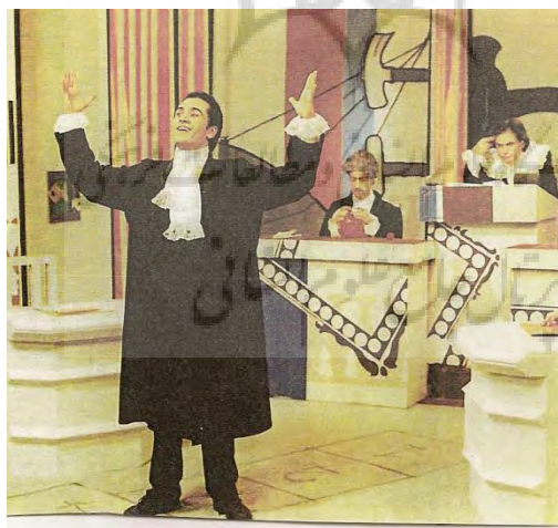
تصویر ۱: مجموعه طنز نوروز ۷۴ ( مجله سروش ، بهار ۱۳۷۴ )