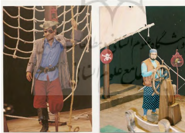
تصویر ۲: مجموعه طنز جنگ ۳۹