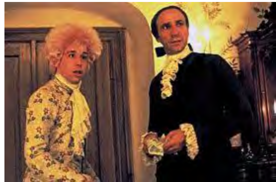
تصویر ۴ : فیلم آمادئوس

تجمل و شکوه و معروفیت به تدریج به دوران فقر، غم، اندوه و پیری می رسد، که در آن لباس به همراه گریم کمک به هرچه بهتر نشان دادن این مراحل می کند. ( تصویر ۴ )