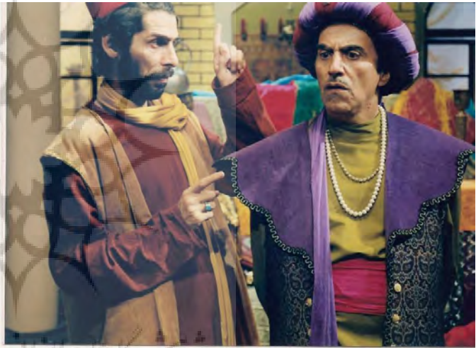
تصویر ۳ : مجموعه طنز ادبی شاخه طوبی ( آرشو شخصی مولف )

تعادل در صحنه نمایش الزامی بوده مگر آنکه به عمد می بایست عدم تعادل را به نمایش گذاشت . برای ایجاد کادری متعادل در فضایی وسیع و کم رنگ باید لباس بازیگر پررنگ و متضاد با رنگ صحنه باشد تا بیشترین جلوه را داشته باشد . این حس در تلویزیون و تئاتر با توجه به آنچه ذکر شد موثرتر است. برای بیشتر جلوه گر شدن بازیگر اصلی در نمایش در میان جمع ، فرد اصلی با خلوص رنگی بیشتری و یا در تضاد با رنگهای دیگر مشخص می شود . هرچه این عوامل بیشتر مورد توجه قرار گیرند و به نقش آنها اهمیت بیشتری داده شود، تصویری که به نمایش در آمده است، با بیننده خود ارتباط بهتری برقرار می نماید . ( تصویر ۳ )