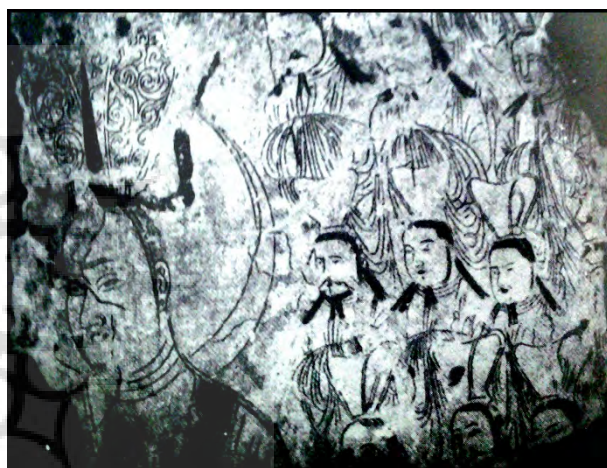
۱-قطعه ای از یک طومار-کتاب مصور ( کلیم کایت، ۱۳۷۳، ۱۸۱ )

این هنر، محدود به مرزهای داخلی ایران نبود بلکه بارواج آن در آسیای دور نقاشی معروف به سبک چینی را به وجود آورد و صنعت مصورسازی و کتاب سازی را در ممالک گوناگون معمول نمود ایرانیان بیش از آنکه به مانی ارزش پیامبری بدهند، وی را صورتگری چیره دست می دانند. براساس منابع تاریخی معتبر به دستور مانی، تالارهایی به نام "نگارستان" ساخته شد و دیوارهای آن ها با نقاشی هایی بر اساس فلسفه ی آیین او و با مضامینی چون خلقت انسان و سرنوشت وی تزیین گردید. (www.souregroup.com) مانی نقاش چیره دست ایرانی، کتاب های خود را با شکل ها و نقش های زیبا تزیین می کرد تا بهتر بتواند پیام های خود را به مردم خویش انتقال دهد. " وی براین باور بود که سخنان اش باید به گونه ای بیان شود که برای همه ی مردم قابل فهم باشد. کتاب ارژنگ رامی توان ابتکارمانی برای تکمیل آموزش آیین خود به توده ی مردم به ویژه کم سوادان و کم دانشان دانست. در فرهنگ فارسی دکتر معین آمده است : " وی برای این که اصول آیین خود را به بی سوادان بیاموزد، آنها را با تصاویر زیبار کتاب های خود جلوه گر می ساخته است و به همین سبب وی رامانی نقاش می گفتند. " پیامبر روشنی دنیای باستان، سعی بر آن داشته تا با طرح ها و تصاویر زنده و روشن الهام یافته از طبیعت و تخیل ، ایمان مذهبی نوگرایانه اش را در باور پیروانش بکارد و بپرواند . وی ارزش هنر تصویری را شناخته و برسیستم پیچیده ی مذهبی و فلسفی عالم وجود بسط داده است. " (معمارزاده ، ۱۳۸۸: ۳۱) بطور کلی " نقاشی در میان مانویان سنتی پسندیده بود، چون ارتباط ویژه با بانی این آئین، مانی داشت و لقب نقاش چین یا