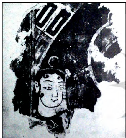
۲-بخشی از یک دیواره نگاره مانوی

چنانچه [ من نقاشی کردم ] مال خود را (ویدن گرن ، ۱۳۷۶: ۱۳۷)