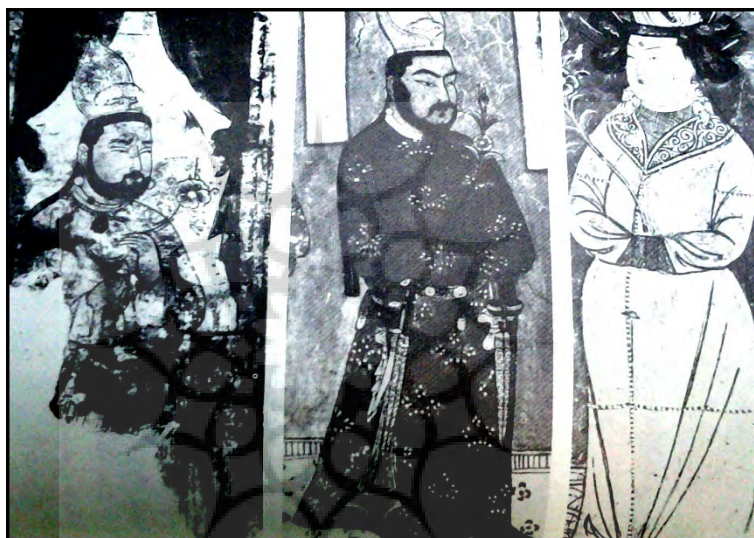
۶-چهره هبه کننده : شاهزاده اویغوری

روشن ، قرمزوسبز. (اسماعیل پور ، ۱۳۹۱: ۵) آنها(کاتبان ) برای رفع یکنواختی سطرهایی که با مرکب مشکلی نوشته می شده اند بسیارراغب بودند که با آوردن چندسطر رنگی بیشتر به رنگ سرخ ارغوانی آن را دل انگیز ترکنند ظاهرا مانویان فن چاپ راورد می کردند زیرا برای هنرخوشنویسی اهمیت بسیار قابل بودند. سنت خوشنویسی به ویژه دردیرهای مانوی ارجمند شمرده می شد این را می توان درنگارش ویژه نامه ها ، ترتیب جذاب ستونها ونظم دقیق ظاهرحروف مشاهده کرد.(کلیم کایت، ۱۳۷۳:۶۶) نوشته ها معمولا به رنگ سیاه ویامرکب هندی که از لحاظ مقاومت در برابر رطوبت وآب برای قرنها شناخته شده بود نوشته می شد. ترتیب متون نیز درنهایت دقت انجام می گرفت یک صفحه کتاب یاتمامی سطح آن ازنوشته پوشیده می شد یابه دوستون نوشته ویابیشترتقسیم بندی می گردید. عنوانها محتملا درشت ورنگی ودرطرف رساله که ازآن بحث می رفت گذاشته می شد. گلها وترئیناتی که اطراف آن رامی گرفت ازهمان رنگ نوشته بود امانقطه گذاریها بارنگهای متضاد وبه صورت خطوط کوتاه ونقطه انجام می گرفت.(ویدن گرن ، ۱۳۷۶:۱۴۲) همانگونه که ذکرگردید برای اجنباب ازیکنواختی ، معمولا خطوطی بارنگی دیگر که اغلب نارنجی بود بین دو خط معمولی سیاه رنگ عرضه می گردید. جلد کتابها نیز بنابر الگوی اروپایی غالبا امرذیقیمی بود. گوشه های جلد اغلب درعاج یاچرم لعاب داده یاپوست گوساله پوشیده می شد.جلدعبارت بود ازصفحه مقوایی که بایک ورقه ضخیم طلا قاب شده وبا صدف لاک پشت تزیین یافته بود.(همان :۱۴۳)