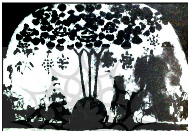
۳- درخت سه تنه در بازاکلیک (دیوارنگاره، خوچو) (کلیم کایت، ۱۳۷۳: ۱۲۹)

اویغور به مانویت در سال ۷۶۰ میلادی موجب تغییر این تزئینات گردید. پرستشگاه دیگر زاغه، که توسط گرونودل (Grunwedel) در سال ۱۹۰۵ بررسی شد؛ شامل نقوشی با مرکب هندی و تصاویری با رنگهای قرمز روشن، سبز و زرد تیره می باشد. نقش این فرسک ها شامل دوازده پیکره، یک درخت سه تنه با میوه های بسیار و چهار پیکر زانو زده است. " فرسک های یافت شده در خوچو در بردارنده ی صحنه ای از مقربان باجامگان سفید نیز می باشد. در مجموع نقاشی های دیواری مانی، متأثر از نقاشی بودایی دوره ی تانگ است که البته از هنر ساسانی و چینی نیز بی تاثیر نبوده است. استفاده از پس زمینه ی خاکستری کمرنگ و رنگ مایه های روشن و سیالی خطوط، همگی حاکی از تأثیرات هنر چینی می باشد و نقش ایزدان در چهار چوبی کادربندی شده با مهره های درشت تزئین یافته نشان دهنده ی نفوذ هنر ساسانی بر مانویت است. (هامبی و دیگران، ۱۳۷۶: ۱۸) دیوارنگاره ها اگرچه به دلیل ساختار فیزیکی از ثبات بیشتری در مقایسه با دیگر آثار برخوردارند اما خاصیت سکونشان آنها را از لحاظ قدرت تاثیرگذاری بر مخاطب در کنار دیگر عناصر تبلیغی کم رنگتر می سازد.