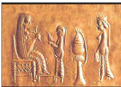
۶- مهر هخامنشی؛ موزه لوور

در تصاویری که از بانوان سلطنتی هخامنشی و ملازمان آنان در مجموعه پازریک کشف شده است نیز استفاده از این چنین پوشش چادر مانند دیده می شود که تاجی را نیز بر آن نهاده اند. همچنین در مهر بسیار ظریفی که در موزه لوور موجود است ملکه ای بالباس و چادر هخامنشی و تاج بر مسند شاهانه تکیه زده و در مقابل او ندیمه ای بدون کلاه با موهای بافته ایستاده است. این چنین به نظر می رسد که داشتن چادر نوعی تشخیص در میان زنان درباری محسوب می شده است.