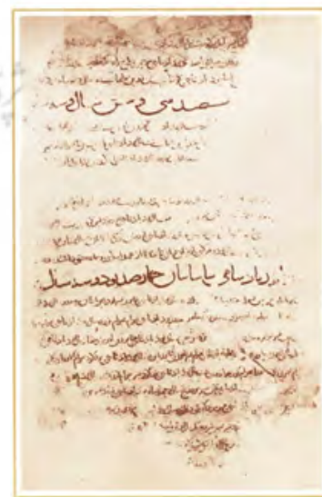
تصویر ۸- پادشاهی ساسانیان، نسخه کاما، کتاب معرفی نسخه‌های شاهنامه فردوسی ص چهارده