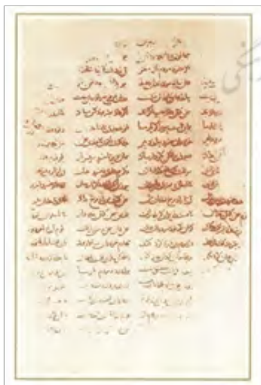
تصویر ۱۰- نسخه کاما، ۸۷۳ برگ، کتاب معرفی نسخه‌های شاهنامه، فردوسی ص ۱۸

"شاهنامه کاما" یکی از قدیمی‌ترین نسخ شاهنامه است که تا کنون شناسایی شده مربوط به دوره سلجوقیان است. اولین بار این کتاب توسط مرحوم غروی طی مقاله‌ای در سال ۱۳۵۲ در مجله هنر و مردم معرفی می‌شود که بنابر نظر مرحوم مینوی این شاهنامه مربوط به دوره سلجوقی است. اما بر اساس پی‌گیری‌های مکرر اینجانب از مؤسسه شرق شناسی کاما در بمبئی این اثر ارزشمند تاریخی ایران جستجوهای فراوانی برای یافتن ردپایی از این اثر انجام شد که متأسفانه در هیچ کتاب و هیچ سایتی درباره این شاهنامه اطلاعاتی موجود نیست و اگر هست تنها اشاره‌ای کوتاه درباره محل نگهداری این شاهنامه به دست می‌دهد. ظاهراً این شاهنامه در مؤسسه کاما در شهر بمبئی نگهداری می‌شده که با توجه به استعلام شخصی مؤسسه مدعی شده که شاهنامه به فردی ناشناس فروخته شده و دیگر در اختیار آن مؤسسه نیست و امکان تحقیق در خصوص آن را متأسفانه از دست دادیم. اما آن چه مورد پژوهش قرار گرفت بر اساس چند تصویر منحصر به فرد که در کتاب "معرفی نسخه‌های شاهنامه فردوسی" چاپ شده و مورد استفاده این مقاله قرار گرفته است. قطع این کتاب ۲۹ × ۲۳ سانتی متر است. تعداد کل ورق‌های آن ۳۰۹ و تعداد تصاویرش ۴۵ است. (شریف زاده، ۱۳۷۵: ۷۷).