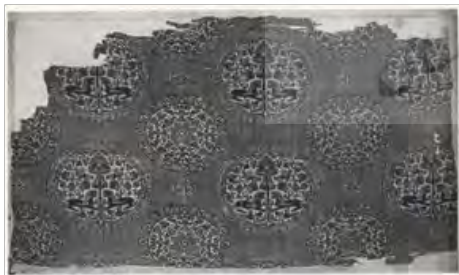
تصویر ۱- پارچه ابریشم و پشم، سفید و سرمه ای ۵۳ × ۳۰ سانتی‌متر مجموعه مور در دانشگاه بیل کتاب شاهکارهای هنر ایران ص ۱۳۳

با آن که کتاب‌های مصوری چند از این عصر به جای مانده و نیز چند نقاشی دیواری اما برای شناخت هنر نقاشی ایرانی عصر سلجوقی بهترین اسناد موجود کاشی‌ها و سفال‌های لعابدار منقوش این دوران می‌باشد. سفال‌گران دوره سلجوقی تکنیک جلادادن ظروف سفالی را که در دوره عباسی شایع بود احیا کردند رنگ ظروف جلادار ایران در دوره سلجوقی متنوع است و از سبز طلایی کمرنگ تا قهوه‌ای تیره روی لعاب سفید دیده می‌شود گاهی رنگ آبی یا فیروزه‌ای نیز بکار رفته و این رنگ در چند بشقاب و ابریق که در موزه متروپولین است یافت می‌شود. (دیامند، ۱۳۳۶: ۱۷۷ و ۱۷۸).