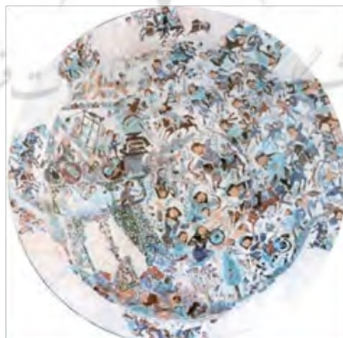
تصویر ۶- تسخیر یک قلعه، قرن هفتم هـ. ق. گالری هنر فریر. کتاب مروری بر نگارگری ایرانی ص ۴۶