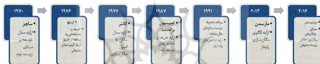
شکل (۱). نگاره فرآیند شکل‌گیری مفهوم پایداری در مکان‌سازی

(۱۷). انگاره‌های پایداری و جریان توسعه پایدار از سال ۱۹۶۱ یعنی زمانی که سازمان ملل متحد به طور رسمی اقدام به تهیه برنامه‌های حفاظت از طبیعت نمود، به رسمیت شناخته شد و به عنوان یک موضوع بسیار مهم مطرح گشت. پیش‌زمینه و مقدمه توسعه پایدار، یعنی توسعه بر مبنای زیست‌بوم از اوایل سال ۱۹۷۰ توسط ساچز، اتحادیه حفاظت جهانی، برنامه محیطی سازمان ملل و برخی دیگر افراد و نهادها مطرح گردید. توسعه زیست‌بوم به عنوان توسعه در سطح منطقه‌ای یا محلی، توأم با توانایی‌های بالقوه ناحیه‌ای و با توجه و تأکید بر بهره‌برداری عقلانی از منابع، کاربرد تکنولوژی و سازمان به گونه‌ای که طبیعت و انسان (جوامع انسانی) را مورد توجه قرار دهد، تعریف شده است. لینچ (۱۹۷۶) در کتاب خود با عنوان «مدیریت حس منطقه ۱» و کرمونا (۱۹۹۷) در کتاب «بعد طراحی برنامه‌ریزی ۲» اشاراتی به اهمیت کیفیت‌های محیطی و لزوم ارائه اسناد مربوط به رهیافت‌هایی چون مکان‌سازی را در طرح‌های توسعه و عمران شهری و فرا شهری نموده‌اند. شکل (۱) خلاصه‌ای از تحقیقات پیشین مرتبط با موضوع را در سطح ایران و جهان نشان می‌دهد.