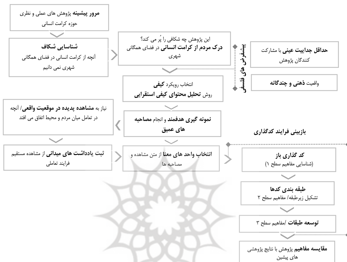
شکل (۱). فرآیند پژوهش

از میان مطالعات انجام شده در این حوزه می‌توان به مطالعه‌ی کاو ۲۰۱۹، اشاره کرد که به روابط اجتماعی و الگوهای استفاده از فضاهای همگانی شهری در انگلستان و چین اشاره کرد که به تجزیه و تحلیل الگوهای استفاده از فضای همگانی و انواع روابط اجتماعی می‌پردازد. داده‌های مشاهده شده‌ی این مطالعه از چهار فضای عمومی واقع در شزو چین و شفیلد انگلستان استخراج شده و ویژگی‌های شخصی کاربران، فعالیت‌های آن‌ها و نحوه اشغال فضای همگانی را مورد تحلیل قرار داده است. نتایج این مطالعه به اهمیت فضاهای همگانی برای انواع کاربران و نحوه‌ی استفاده از آن فضا و گروه‌های مختلف اجتماعی می‌پردازد. مطالعه دراوکوف ۲۰۱۹، به بازنگری مفهوم کرامت انسانی در عصر جدید می‌پردازد. در این مطالعه عزت نفس را یکی از مفاهیمی می‌داند که در چند دهه گذشته به طور چشمگیری تغییر کرده است. این مطالعه تلاش می‌کند که این مفهوم را از مخاطرات فناوری‌های جدید و امکان تهدید شأن انسانی مورد توجه قرار دهد.