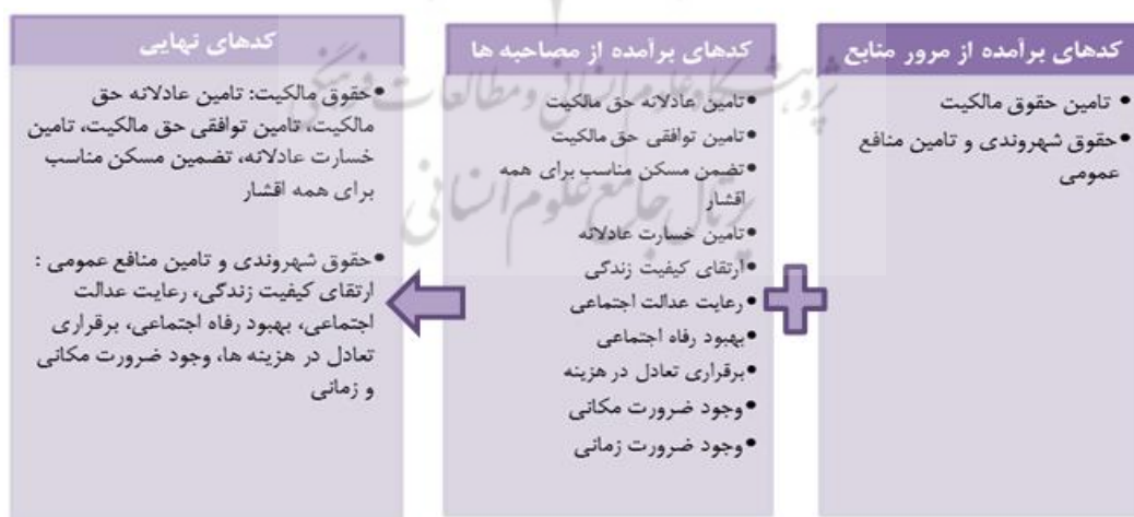
شکل (۴): پالایش کدهای مکانی از منابع و مصاحبه با متخصصان و استخراج کدهای نهایی

چالش‌هایی که در فرآیند اقدامات نوسازی برزو می‌کند، عمدتاً از عدم تعادل میان منافع عمومی و حقوق مالکیت ناشی می‌شود. عبارتی دیگر این اقدامات که در بستر فضاهای شهری به اجرا در می‌آیند مالکیت خصوصی را تحت تاثیر قرار داده و از آن تاثیر می‌پذیرند و سبب ایجاد تعرضاتی میان حق ساکنین به شهر و حق به فضای خصوصی می‌شود. (شفیعی و خدابخش، ۱۳۹۱: ۱-۱۶) لذا به منظور دستیابی به معیارهای مطلوب هر شاخص، ابتدا طی مصاحبه‌ای باز با اساتید بافت فرسوده، در راستای چارچوب تدوین شده، به گردآوری نظرات و معیارهای حائز اهمیت در هر شاخص پرداخته شده است. فرآیند فوق با استفاده از روش دلفی ۱ پیگیری شد. انتخاب حلقه صاحب‌نظران بخش بسیار مهمی از روش دلفی و آگاهی این گروه از موضوع مورد نظر، تضمین خوبی برای کیفیت بالای نتایج دلفی است. پس از تحلیل مصاحبه‌ها و شناسایی معیارهای حایز اهمیت از دید اساتید، کدهای مکانی استخراج و پس از متناظرسازی با کدهای مکانی مستخرج از مرور منابع، ۱۰ کد بعنوان کدهای مکانی موثر بر ابعاد حقوقی قوانین بازآفرینی بافت فرسوده تعیین شد شکل (۴).