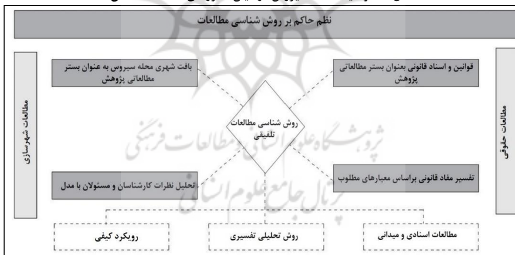
شکل (۲). نظم حاکم بر روش شناسی مطالعات