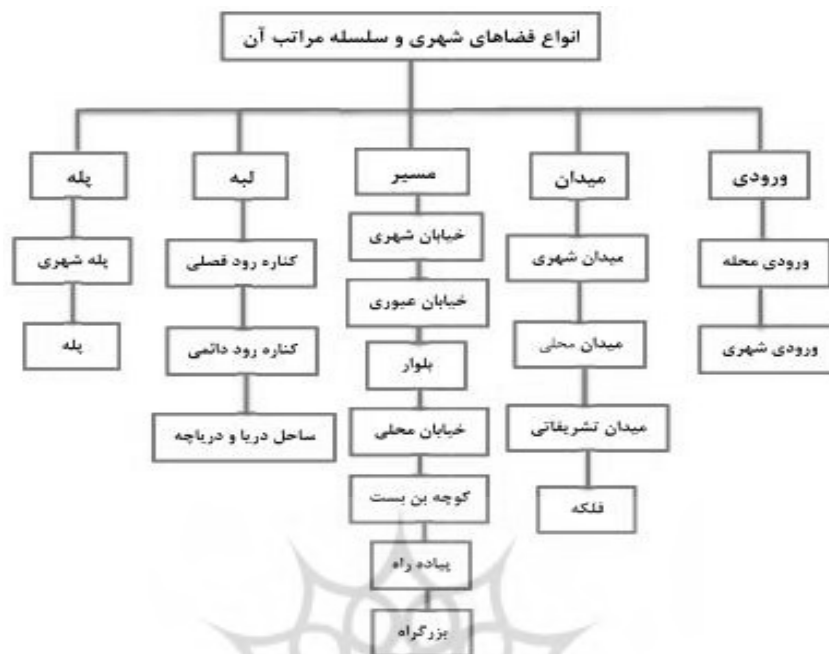
شکل (۱). انواع فضاهای شهری و سلسله مراتب آن