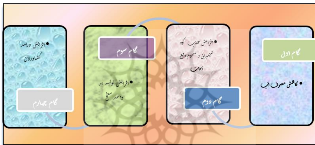
شکل ۳. اثرات کشت هیدروپونیک

الگوریتم خوشه‌ای کردن روستاها به منظور ظرفیت‌سنجی کشت هیدروپونیک با روش تحلیل خوشه-ای