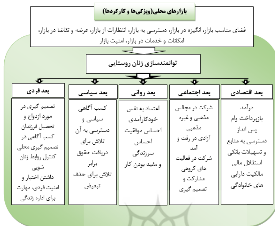
شکل ۲. مدل مفهومی تحقیق، نقش بازارهای محلی در توانمندسازی زنان روستایی

با توجه به جایگاه بازارهای محلی در زندگی روستاییان، شناخت اثرات و پیامدهای آن از زوایای مختلف بسیار مهم و ضروری است؛ این در حالی است که اغلب این مطالعات در خصوص تاثیرات بازارهای محلی، کمتر به برآیندهای آن در زندگی زنان روستایی و توانمندسازی آنها برای رویارویی با چالش‌های مختلف پرداخته است. لذا در این مطالعه پیشینه مطالعاتی را بر اساس متغیرهای اصلی تحقیق می‌توان به دو بخش مطالعات مربوط به بازار و مطالعات مرتبط با توانمندسازی زنان دسته بندی نمود (جدول ۱).