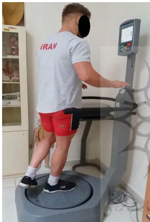
شکل ۲: اندازه‌گیری تعادل تک پا

حرکت در ۳ بار تکرار آزمون ثبت شد (۱۵) (شکل ۱). برای اندازه‌گیری تعادل پویا از دستگاه تعادلی بایودکس و پروتکل ایستادن روی یک پا استفاده شد. دستگاه بایودکس شامل یک صفحه دایره‌ای مدرج به نام صفحه تعادل سنج که روی یک گوی بزرگ شامل چند حس گر هست قرار دارد و می‌تواند در جهت‌های مختلف نسبت به وضعیت افقی تغییر حالت یابد. این صفحه به کوچک‌ترین تغییرات مرکز ثقل حساس بوده و به راحتی با تغییر اندازه نیروی فشار پاها، جهت صفحه متناسب با جهت و اندازه نیروی گشتاوری اعمال شده تغییر می‌کند. دستگاه تعادل سنج نتیجه انحراف مرکز ثقل از مرکز سطح اتکا را در قالب سه شاخص تحت عناوین شاخص انحراف کلی، شاخص انحراف در جهات قدامی-خلفی و داخلی-خارجی به صورت لحظه‌ای ثبت می‌کند. ثبات صفحه تعادل سنج از درجه ۸ (ثبات متوسط) شروع شده و به درجه ۲ (ثبات کم) می‌رسد. آزمودنی در طی ۲۰ ثانیه تعادل خود را در مرکز حفظ کرد (۱۶) (شکل ۲).