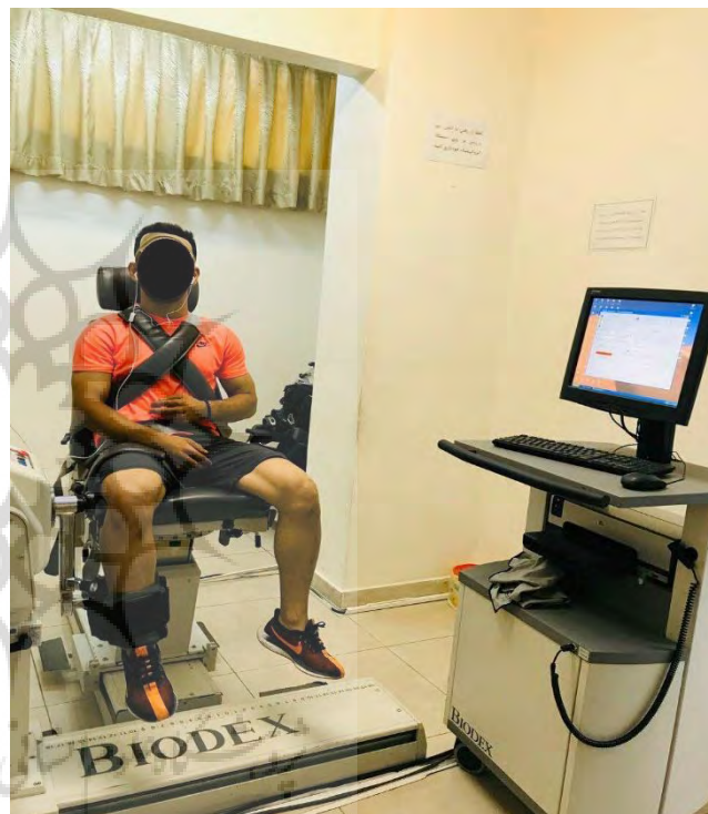
شکل ۱: اندازه‌گیری حس عمقی زانو

در این پژوهش آسیبی ثبت شد که ۱. در زمان شرکت در تمرین یا مسابقه رخ داده باشد، ۲. نیازمند کمک تیم پزشکی برای رسیدن به وضعیت کشتی‌گیر اقدام کند، ۳. کشتی‌گیر آسیب‌دیده قادر نباشد در جلسه تمرینی یا مسابقه روز بعد شرکت کند (۱۷). این آسیب‌ها توسط کادر پزشکی در زمان تمرین و مسابقه ثبت می‌شد و به صورت هفتگی جمع‌آوری می‌شد. برای بررسی نرمال بودن داده‌ها از آزمون آماری K-S استفاده شد. برای بررسی رابطه بین حس عمقی و تعادل پویا و میزان بروز آسیب از آزمون رگرسیون لجستیک در سطح معنی‌داری \alpha \leq 0.05 استفاده شد.