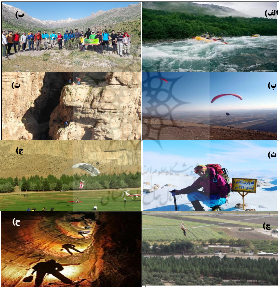
شکل ۳. سایت‌های گردشگری ماجراجویانه در استان کرمانشاه. (الف) رفتینگ در رودخانه سیروان (ب) کوه‌پیمایی در دره سیروله (پ) صخره‌نوردی در آبشار پیران (ت) سایت پرواز ویس القرنی (ث) ارتفاعات شاهو (ج) ورزش‌های هوایی در بیستون (چ) اسلکینگ

در بیستون (ح) غار پرآو، منبع: نگارندگان، ۱۳۹۹