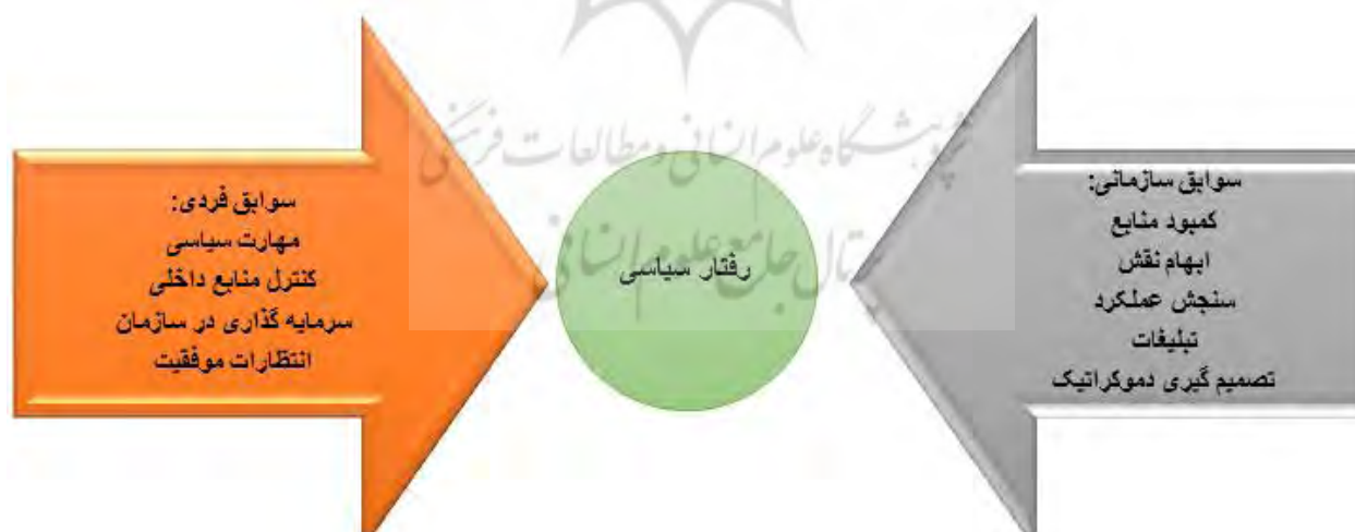
نمودار ۱- مدل مفهومی پژوهش

از مرور مطالعات گذشته به مدل مفهومی زیر دست یافته ایم: