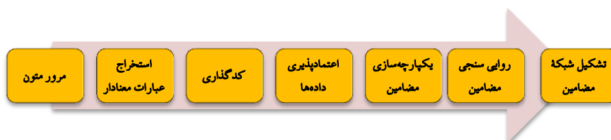
شکل ۱: روند پژوهش

اعتمادپذیری داده‌های کیفی به شیوه‌های زیر انجام شد؛ گردآوری داده‌ها از منابع متعدد و هم‌گرایی بین داده‌ها. شیوه دیگری که به روایی یافته‌های پژوهشی کمک کرد، هم‌سوسازی مضامین به دست آمده از منابع مختلف بود؛ یعنی داده‌هایی که از منابع مختلف به دست آمد، در مرحله مقوله‌بندی یکدست شد و مضامینی که با پژوهش مرتبط نبودند یا خلاف اسناد مکتوب بودند، حذف شدند.