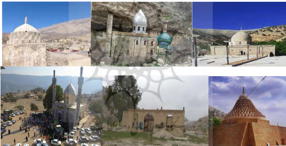
از راست به چپ

امامزاده علی(ع) - امامزاده حمزه(ع) - امامزاده سید الجلال الدین(ع) امام زاده محمود(ع) - امامزاده اسماعیل(ع) - امامزاده یحیی(ع)