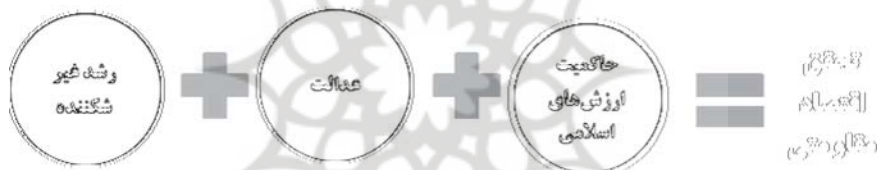
شکل ۲ هم‌افزایی رشد، عدالت و مقاومت اقتصادی همراه با معنویت در پرتو حاکمیت مؤلفه‌های فرهنگ اقتصادی در اقتصاد مقاومتی

ترویج مؤلفه‌های فرهنگ اقتصادی مطلوب در اقتصاد مقاومتی، همچنین باعث کاهش تولید کالاهای تجملاتی و واردات کالاهای غیرضروری در جامعه می‌شود؛ چراکه به علت نهمی از اسراف و تأکید بر مصرف در حد کفاف، درآمد مازاد به اقشار کم‌درآمد جامعه منتقل می‌شود. لذا تقاضا برای کالاهای تجملاتی و واردات کالاهای غیرضروری در جامعه کاهش می‌یابد.