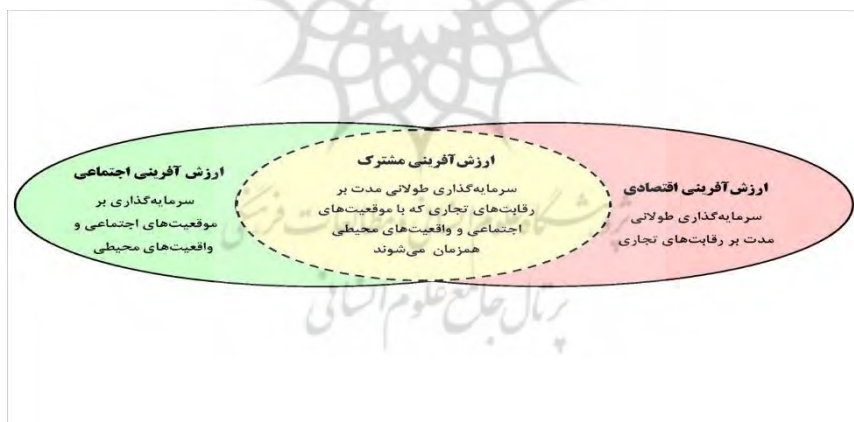
شکل شماره ۳: خلق ارزش‌آفرینی (Bockstette & Stamp, 2012)

مفهوم ارزش‌آفرینی ۱ برای اولین بار در مقاله‌ای که توسط پورتر و کرامر ۲ در سال ۲۰۰۶ منتشر کردند، در عرصه کسب و کار به کار رفت. طبق گفته پورتر و کرامر (۲۰۱۱)، ارزش‌آفرینی به بررسی روابط اقتصادی و اجتماعی به منظور ایجاد منافع اقتصادی و اجتماعی، به جای توزیع ارزش موجود است. ارزش‌آفرینی روشی برای دستیابی به اهداف تجاری است که علاوه بر اینکه از طریق نوآوری‌هایی که نیازها و چالش‌های جامعه را برطرف می‌کند، یک مزیت رقابتی برای شرکت‌ها نیز ایجاد می‌کند (Porter & Cramer, 2011: 5). همین سیر تطور مفهومی، نشان می‌دهد ظرفیت خوبی برای به‌کارگیری این مفهوم در سایر عرصه‌ها وجود دارد. این مهم، در عرصه بانوان و ادبیات مربوط به ملاحظات جنسیتی سابقه نداشته است.