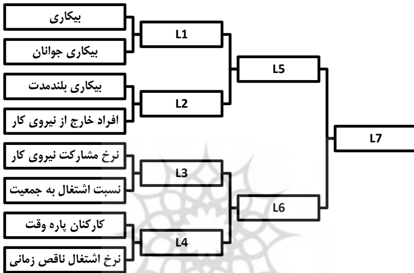
شکل ۱- استخراج شاخص ترکیبی بازار نیروی کار بر مبنای مدل ارائه‌شده در تحقیق

شده و عدد بزرگ‌تر نشانگر بهتر بودن وضعیت نیروی کار است. در شکل شماره (۱) متغیرهای توضیح‌دهنده نیروی کار و چگونگی ترکیب آن‌ها نمایش داده شده است. در این ترکیب متغیرها، سعی شده است که متغیرهایی که مربوط به حیطة خاصی از نیروی کار می‌شوند، با هم در یک گروه ترکیبی قرار بگیرند.