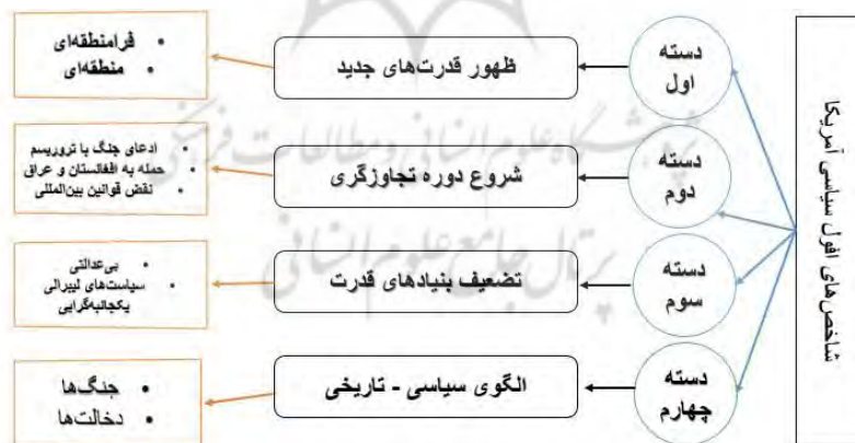
نمودار ۱. شاخص‌های افول سیاسی آمریکا