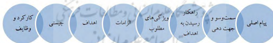
شکل ۲. رئوس اصلی موضوع رسانه در بیانات مقام معظم رهبری

برای فهم دقیق‌تر بیانات مقام معظم رهبری مضامین سازمان دهنده در شکل ذیل می‌آید: