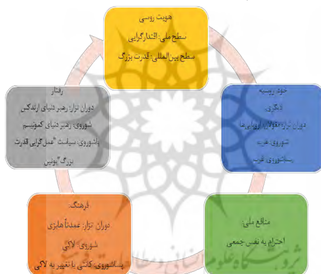
شکل ۱: تداوم هویت روسی بر اساس مفروض‌های سازه‌انگاری

درگیری‌های اوکراین و کاهش پیامدهای ناشی از تحریم را برای تقویت روابط دوجانبه دنبال کنند (Božo, 2018: 31). بر اساس آنچه گفتیم و در یک نگاه کلی می‌توان گفت، مسکو از یک سو در جهت تقویت قدرت خود در برابر غرب تلاش کرد، اما از سوی دیگر به این واقعیت نیز به خوبی آگاه بود که توسعه این کشور بدون همکاری با غرب امکان نخواهد داشت و از سوی غرب نیز به همکاری با روسیه برای تأمین منافع خود نیاز دارد. بنابراین به باور درک وره، بازنگری پوتین از جایگاه روسیه در سیاست جدید جهانی، فرصت انتخاب «توسعه عمل‌گرایانه و چندبرداری، همراه با امکان دفاع قاطع، اما غیرمقابله‌جویانه از منافع ملی را در عرصه خارجی» برای این کشور فراهم آورده است (Noori, 2010B: 210).