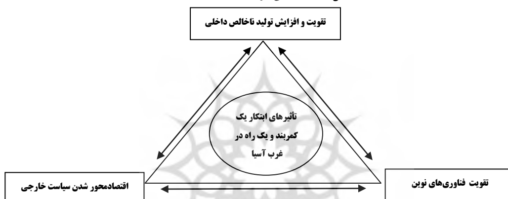
شکل ۱. مدل علی فرایندهای اقتصادی

ادامه می‌آید: تغییرهای فناوری و وابستگی متقابل اقتصادی و تقاضاهای سیاسی داخلی برای افزایش استاندارد چرا که رفاه اقتصادی ملی هدف سیاسی مسلط است و افزایش تولید ناخالص ملی نشانه سیاسی اساسی است و همچنین سودها و مزایای کلان ناشی از تحرک بین‌المللی سرمایه، کالا و کار به دولت‌ها انگیزه تغییر یا بازسازی رژیم‌های بین‌المللی را می‌دهد که نتیجه این سه فرض می‌شود، تغییر رژیم‌های بین‌المللی موجود (Keohane and Nye, 2012).