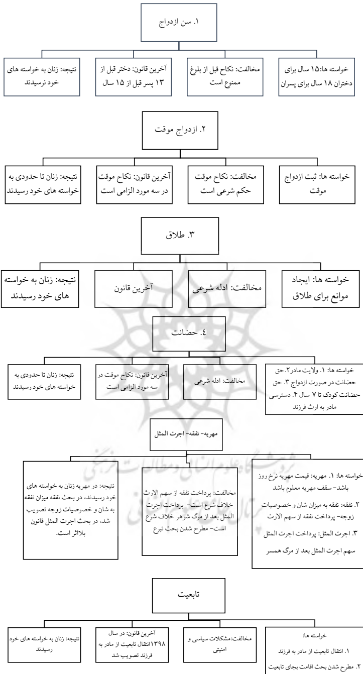
شکل ۲. خواسته‌ها و نتایج به دست آمده: خرده مقوله