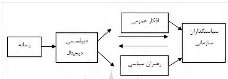
نمودار ۱. الگوی دیپلماسی دیجیتال دوسویه (سلطانی فر و همکاران، ۱۳۹۱)

تعامل دوسویه است. در این الگو، رسانه و سیاست‌گذاران، به صورت ارگانیک و نظام‌مند با یکدیگر در تعامل دائمی هستند و نتایج بررسی و تحلیل‌های خود را با یکدیگر تسهیم می‌کنند و در نهایت، وحدت هدف است و در صورت نیاز یک وحدت رویه را برای آن‌ها به وجود می‌آورند (سلطانی فر و همکاران، ۱۳۹۱، ص. ۱۹۷).