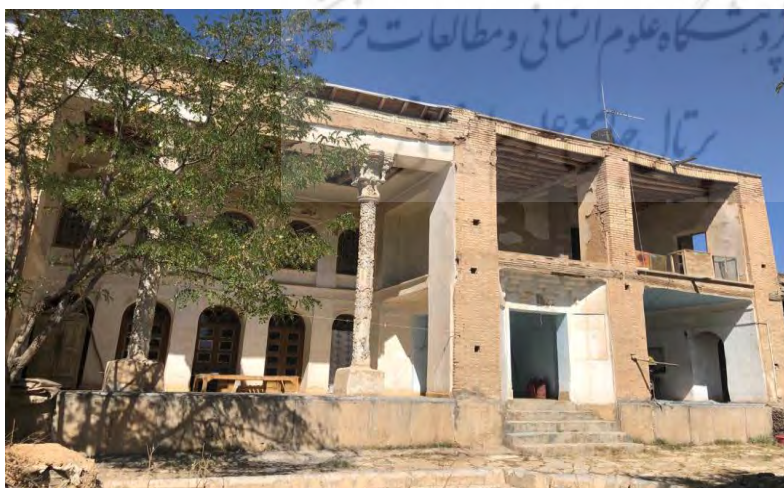
عکس شماره ۴: خانه تاریخی عباسقلی خان ایناللو.