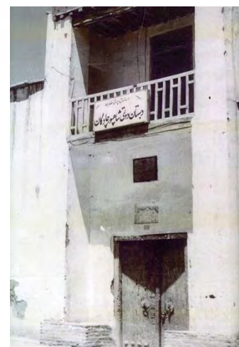
عکس شماره ۳: درب تالار (عمارتی از دوره صفوی)