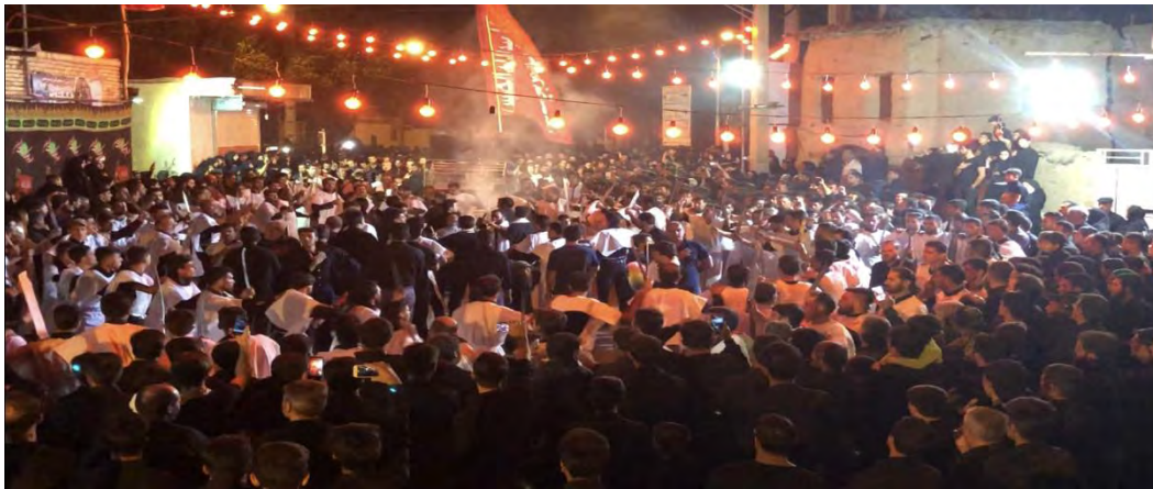
عکس شماره ۱: مراسم مشق شمشیر شب عاشورا ۱۳۹۷ ش.