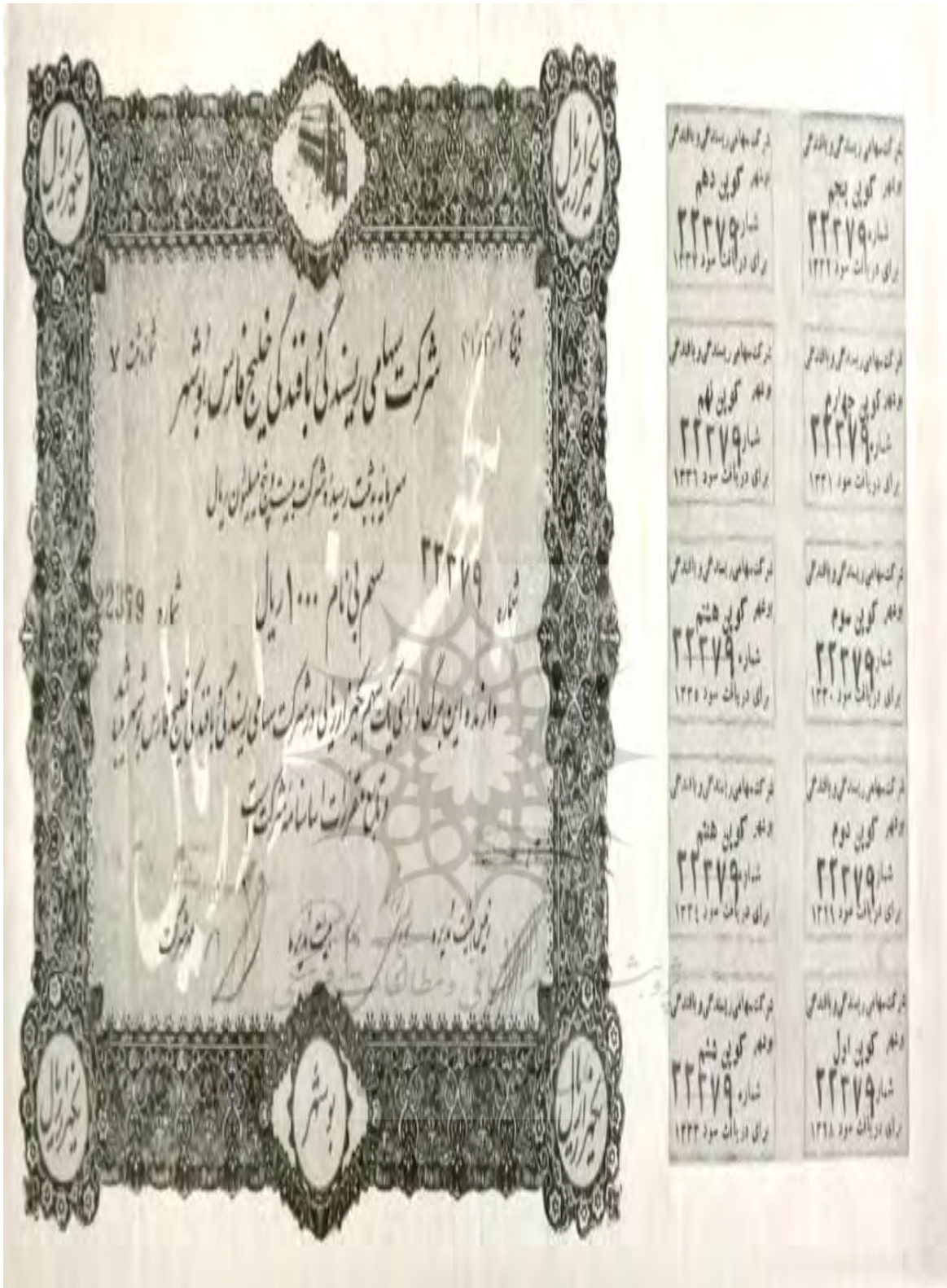
تصویر شماره ۶: سند شماره ۳ و ۲: نمونه سهام واگذار شده بی نام شرکت اعتمادیه به مبلغ ۱۰۰۰ ریال به تاریخ آبان ۱۳۱۷ ش.