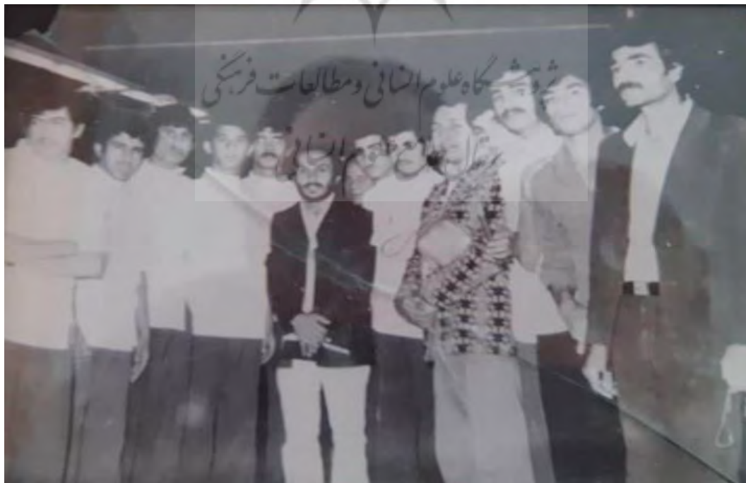
تصویر شماره ۲: کارکنان شرکت اعتمادیه.