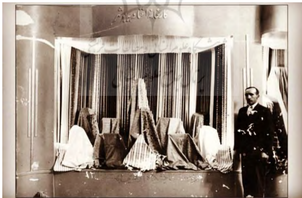
تصویر شماره ۴: انواع پارچه‌های تولید کارخانه اعتمادیه.