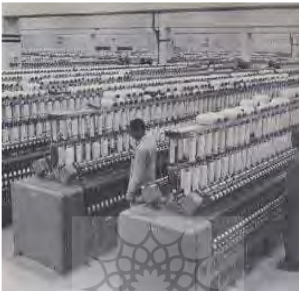
تصویر شماره ۳: انواع نخ‌های شرکت اعتمادیه تولیدی.