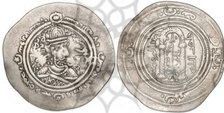
شکل ۶. درهم ویژه محراب و عنزه، احتمالاً سال ۵۷۵.ق. ۱ (M&E, 26Apr 2017: 3)

نمونه دیگر درهمی زیبایی است که فاقد تاریخ و محل ضرب است؛ اما به احتمال زیاد در شهر دمشق به سال ۵۷۵.ق. به ضرب رسیده است. تصویر شاه و متعلقاتش بر روی این سکه با تصویر شاهان ساسانی بر سایر سکه‌ها کاملاً متمایز بوده است و نشان می‌دهد صاحب سکه با دستانی کوچک شمشیری بر دست دارد؛ پشت سکه نیز به جای آتشدان و موبدان، محرابی به تصویر کشیده شده که در میان آن «عَنْزَه» (نیزه کوتاه پیامبر) با عبارت «نصر الله» عمود قرار گرفته است. همچنین به جای تاریخ در سمت چپ محراب، عبارت «امیرالمؤمنین» و بر جای ضرابخانه در سمت راست، عبارت «خلیفه الله» به خط کوفی جایگزین شده است. (Johns, 2003: 431) از این نکته نیز نباید غافل شد که آنچه اینجا محراب و عنزه دانسته شده، در واقع تغییر یافته تصویر صلیب زیر طاقدیس است که در هنر مسیحیان سریانی رواج داشته است. (Treadwell, 2005: 1-28)