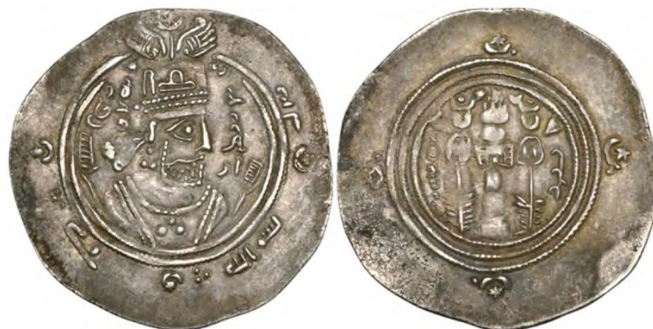
شکل ۱۴. نمونه‌ای از درهم‌های سیستانی-شرقی، بی‌نام، ضرب سیستان، سال ۱۰۷ه.ق. ۱