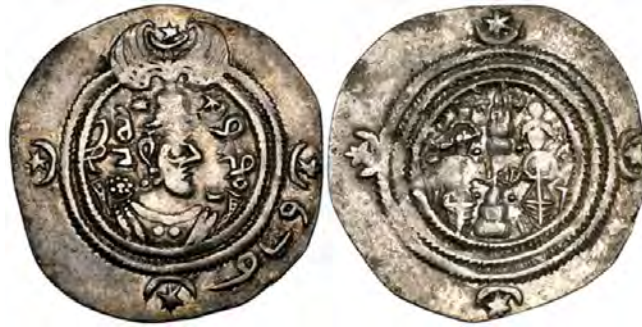
شکل ۱۵. نمونه‌ای از درهم‌های عرب-ارمنی ۱ (M&E, 25 Oct 2017: 6)

اما نمونه سکه‌هایی با تصویر هرمزد چهارم ساسانی (۵۷۹-۵۹۰ م.) ضرب زوزن نیز مشاهده شده که به نظر نگارندگان، برخی سکه‌شناسان به نادرست آنها را نیز در گروه سکه‌های عرب-ارمنی جای داده‌اند؛ زیرا نام ضربخانه بیشتر زوزن بوده و تاریخ ضرب بر این سکه‌ها کلیشه‌ای و ناخوانا (بیشتر عدد شش را نشان می‌دهد) است. عبارت زوزن را به جای نام ضربخانه، به خط پهلوی کلمه ZWNZ به معنی درهم، قرائت کرده‌اند که این نوشتار مانند سکه‌های-ارمنی بوده است.