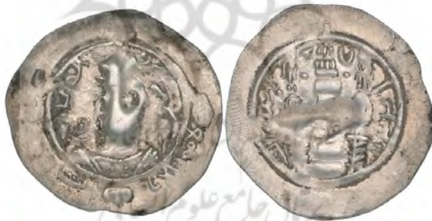
شکل ۱۶. نمونه‌ای از درهم‌هایی با تصویر هرمزد چهارم ساسانی ۲ (M&E, 26 Apr 2017: 4)

اما نمونه سکه‌هایی با تصویر هرمزد چهارم ساسانی (۵۷۹-۵۹۰ م.) ضرب زوزن نیز مشاهده شده که به نظر نگارندگان، برخی سکه‌شناسان به نادرست آنها را نیز در گروه سکه‌های عرب-ارمنی جای داده‌اند؛ زیرا نام ضربخانه بیشتر زوزن بوده و تاریخ ضرب بر این سکه‌ها کلیشه‌ای و ناخوانا (بیشتر عدد شش را نشان می‌دهد) است. عبارت زوزن را به جای نام ضربخانه، به خط پهلوی کلمه ZWNZ به معنی درهم، قرائت کرده‌اند که این نوشتار مانند سکه‌های-ارمنی بوده است.