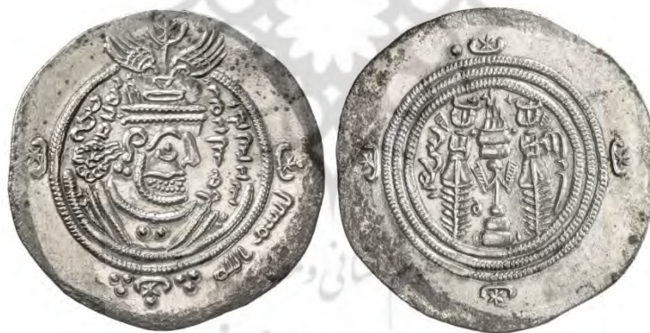
شکل ۴. درهمی از عبدالله‌بن‌زبیر، ضرب فسا، سال ۶۰ ه.ق. (SARC, 17-18 May 2018: 159)

در نهایت پس از اعلام خلافت ابن‌زبیر، مردم بیشتر ممالک اسلامی، از جمله دمشق، کوفه، بصره، یمن، و نواحی مختلف خراسان با نمایندگان ابن‌زبیر به نیابت از او بیعت کردند. (البلاذری، ۱۴۱۷ ج: ۵؛ ۳۴۴ و ۳۷۲؛ الیعقوبی، ۱۴۱۵ ج: ۲؛ ۲۵۵) دستاوردهای این بیعت ضرب سکه به نام ابن‌زبیر و هم‌پیمانانش در سایر بخش‌های سرزمین‌های اسلامی بود. درهم‌های عبدالله‌بن‌زبیر نیز کاملاً شبیه با سایر درهم‌های معاصر خود بود و تفاوتی با آنها نداشت. در مدت خلافت ابن‌زبیر درهم‌هایی با نام‌های عبدالله‌بن‌زبیر در شهرهای ایالات فارس، کرمان و یزد؛ عبدالله‌بن‌خازم سلمی (۷۲-۶۲ ه.ق.) در ایالت خراسان و جی؛ حارث‌بن‌عبدالله (۶۵ ه.ق.) در بصره، دشت، و سیرجان؛ عمر بن عبدالله‌بن‌معمر (۷۰-۶۵ ه.ق.) در بصره، ایالت فارس، و ایالت کرمان؛ عبدالعزیز بن عبدالله‌بن‌عامر (۷۲-۶۶ ه.ق.) در سیستان؛ محمد بن عبدالله‌بن‌خازم (۶۷ ه.ق.) در هرات؛ مصعب بن‌زبیر (۷۱-۶۷ ه.ق.) در بصره، دشت، ایالت فارس، و ایالت کرمان؛ عتاب بن‌ورقاء (۶۸ ه.ق.) در جی؛ و حمران بن‌آبان (۷۲ ه.ق.) در اردشیر خوره به ضرب می‌رسانند.