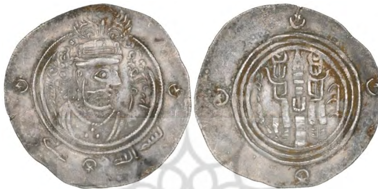
شکل ۱۳. آخرین درهم رسمی عرب-ساسانی، مسمع بن مالک، ضرب سیستان، سال ۸۶.ق. ۱

(۸۲.ق.) ایالت کرمان؛ عمر بن لقیط عبدی (۸۳-۸۲.ق.) در ایالت کرمان؛ خالد بن ابی خالد (۸۳.ق.) در جی؛ عبیدالله بن عبدالرحمن (۸۴-۸۳.ق.) در بصره و کرمان؛ عماره بن تمیم (۸۴-۸۵.ق.) در ایالت سیستان؛ مسمع بن مالک (۸۶-۸۵.ق.) در ایالت سیستان آخرین درهم‌های عرب-ساسانی را به ضرب رساندند.