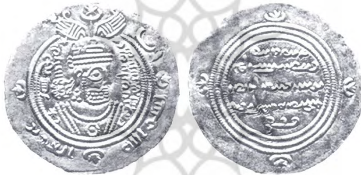
شکل ۵. درهم ویژه عبدالعزیز بن عبدالله بن عامر، ضرب سیستان، سال ۷۲ه.ق. (Mochiri, 1981: 169)