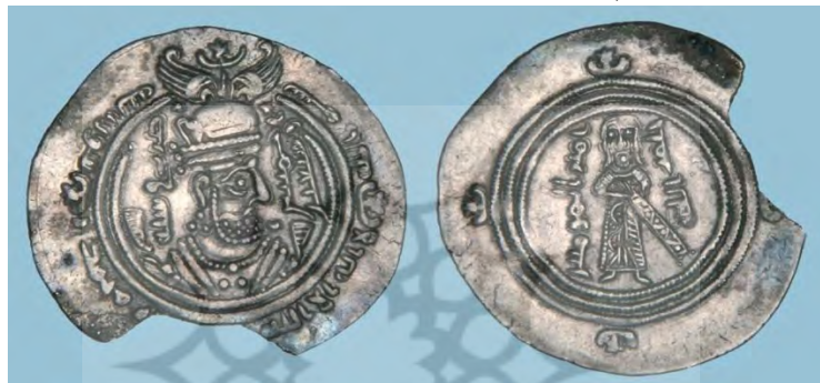
شکل ۷. درهم ویژه‌ی خلیفه‌ی ایستاده، سال ۷۵ه.ق. ۱ (M&E, 23 Apr 2012: 23)

گونه‌ی دیگر از درهم نیز وجود دارد که به سال ۷۵ه.ق. و احتمالاً در شهر دمشق به ضرب رسیده است. بر روی آن نیم تنه خسرو دوم، بدون توپ موی پشت سر به تصویر کشیده شده و پیرامونش به خط کوفی چنین نقر شده: «ضرب فی سنه خمس و سبعین». در پشت این سکه نیز به جای آتشدان و دو موبد، شمایل ایستاده‌ی خلیفه در حالی که دست بر غلاف شمشیر نهاده، به تصویر کشیده شده است. همچنین به جای تاریخ در سمت چپ محراب، عبارت «امیرالمؤمنین» و بر جای ضربخانه در سمت راست، عبارت «خلیفه الله» به خط کوفی جایگزین شده است. (سلمان، ۱۹۷۰: ۱۶۳-۱۶۷)