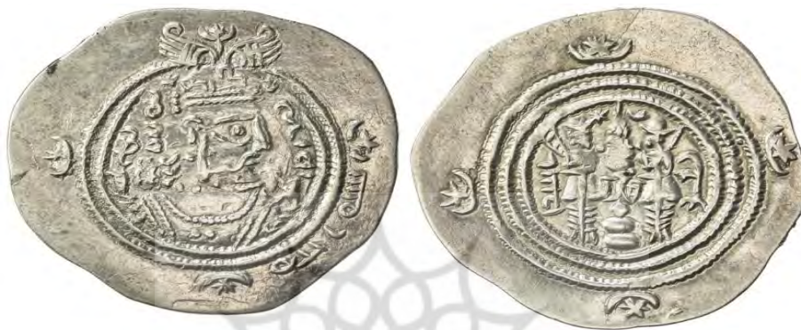
شکل ۲. از اولین درهم‌های عرب-ساسانی، ضرب سیستان، سال ۲۰ یزدگردی ۱ (SARC, 13-14 Sep 2018: 172)

خلدون، ۱۹۸۷: ۱۱۵) صفت بغلی خلاف آنچه پیش‌تر تصور می‌شد، ارتباطی با شخصی یهودی به نام «بغل» ندارد. (Walker, 1941: cxlviii) بلکه در واقع به معنای «قاطر» یا «قاطرمانند» است. شاید دلیل این نامگذاری بال‌های روی تاج شاه ساسانی بوده که آن را شبیه گوش‌های قاطر می‌دیدند. (امام‌شوشتری، ۱۳۳۹: ۷۰؛ Heidemann, 2010b: 25)