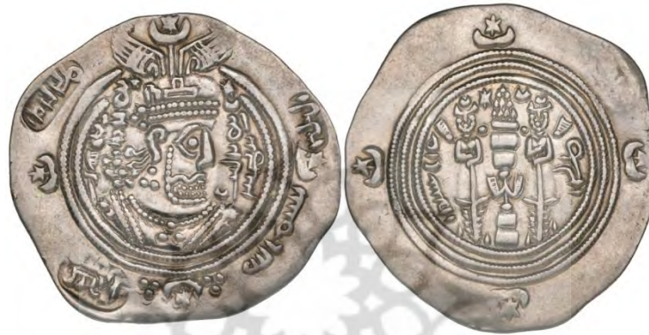
شکل ۱۰. سورشازر بر درهم عبدالله بن خازم، ضرب مرو، سال ۶۵ ه.ق. ۲ (M&E, 26 Apr 2017: 129)

با گذشت زمان هون‌های ایرانی تبار (هپتالیان، هفتالیان، یا هیاطله) که در اوایل دوره اسلامی بر منطقه جوزجان (بخش‌هایی از افغانستان کنونی) حکومت داشتند، بر درهم‌های ساسانی و عرب-ساسانی کلماتی را به خط بلخی یا پهلوی، با یک یا چندین انگ افزوده می‌نمودند و آنها را برای خود رایج می‌ساختند. در این بین سکه‌های عبدالله بن خازم سلمی بیشتر سورشازر را دارند.