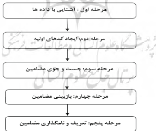
شکل ۲ - مراحل پژوهش به روش تحلیل مضمون ( براون و کلارک ۱ ، ۲۰۰۶)

ساختار این پژوهش که با استفاده از روش تحلیل مضمون شکل گرفته است به صورت شکل ۲ نمایش داده می شود: