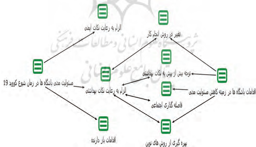
شکل ۳- مدل مفهومی پژوهش بر اساس خروجی نرم افزار مکس کیو دی آ

شکل ۳ مدل مفهومی پژوهش با استفاده از نرم افزار مکس کیو دی آ. مسئولیت مدنی باشگاه های ورزشی در زمان همه گیری ویروس کووید ۱۹ و اقدامات باشگاه های ورزشی برای کاهش مسئولیت مدنی را نشان می دهد.